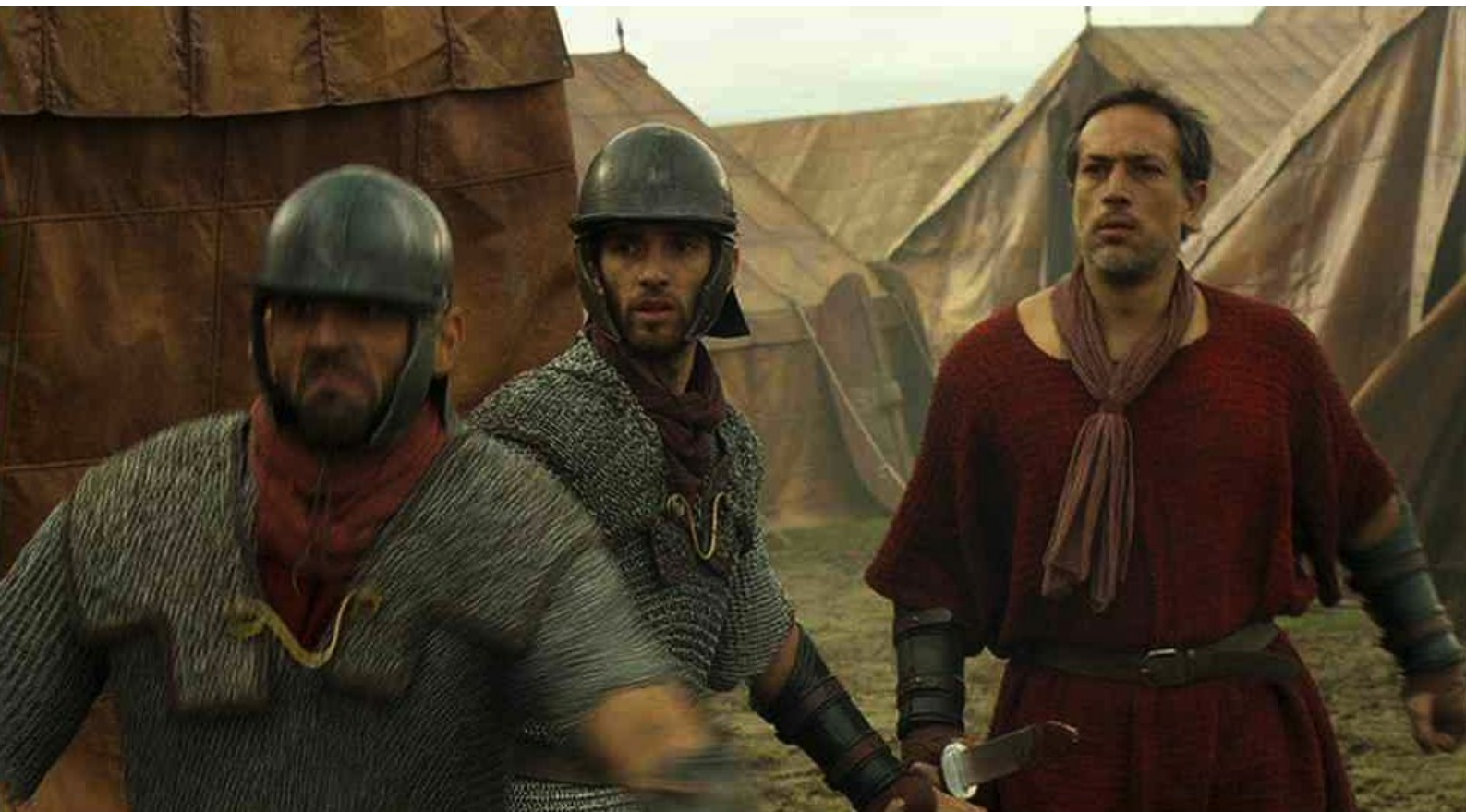
Hispania, la Leyenda : mais des Romains les repèrent,