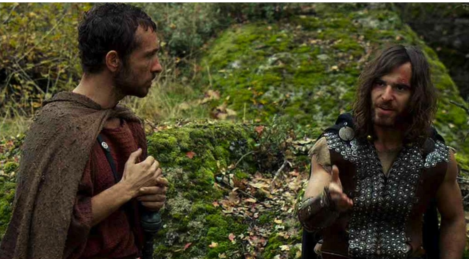
Hispania, la Leyenda : on comprend que c'est Hector le coupable.