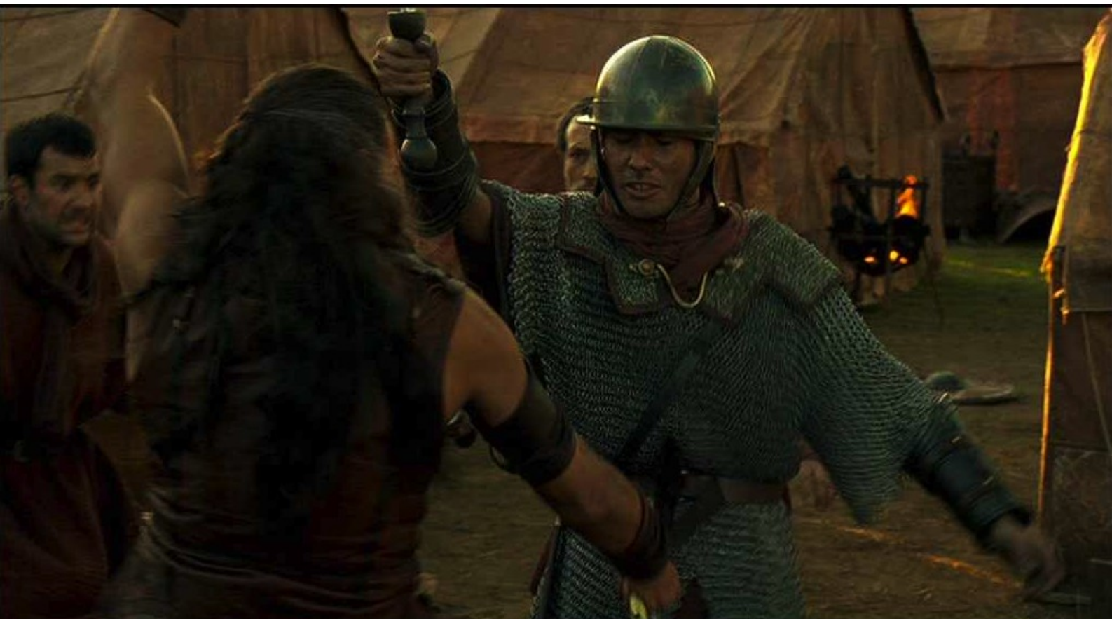
Hispania, la Leyenda : et que le massacre commence,