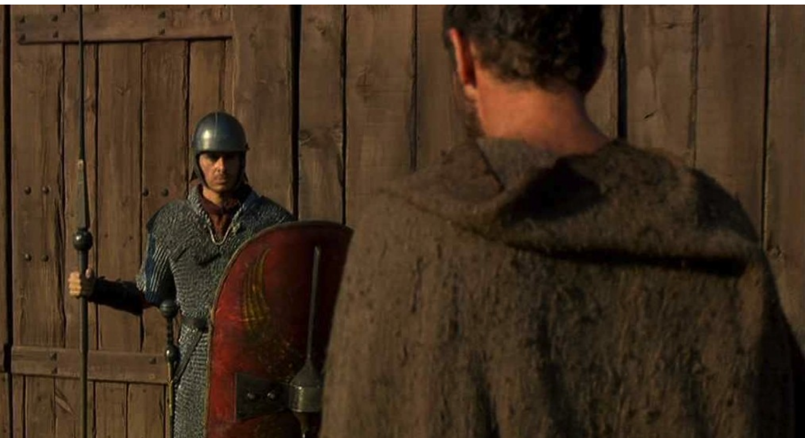
Hispania, la Leyenda : Alors Hector se présente à la porte du camp...