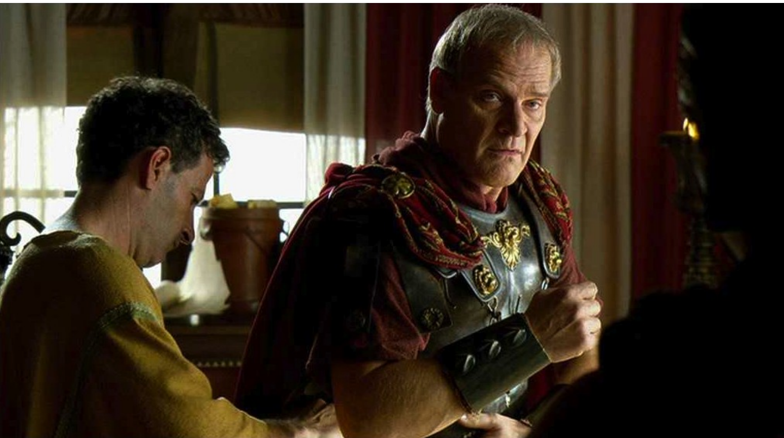
Hispania, la Leyenda : Mais Galba a appris que Viriate a été vu à un autre endroit...