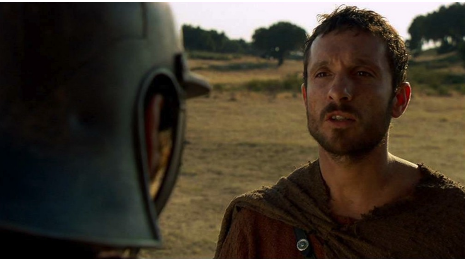
Hispania, la Leyenda : et demande à parler à Galba ;