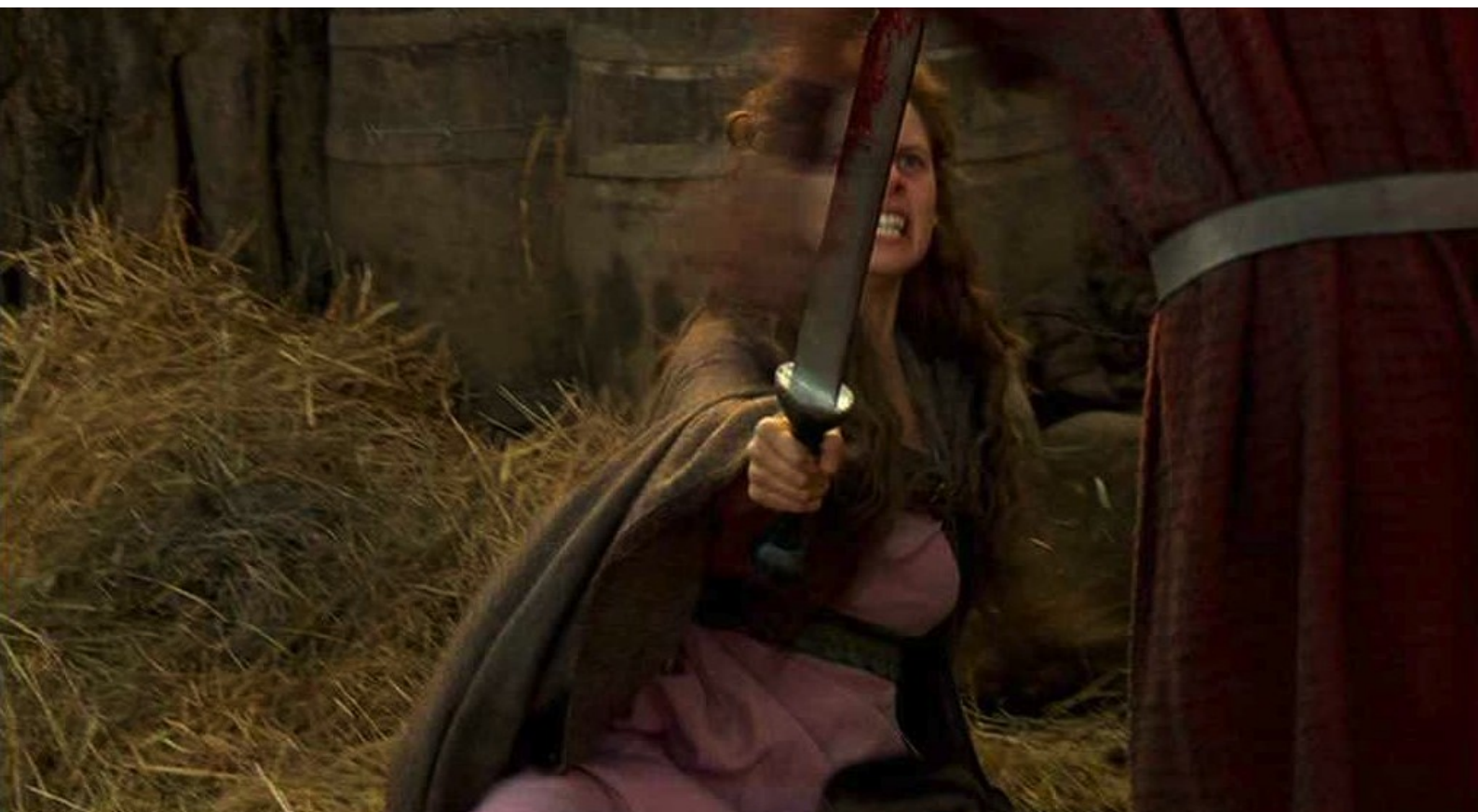
Hispania, la Leyenda : et elle essaie tant bien que mal de se défendre ;