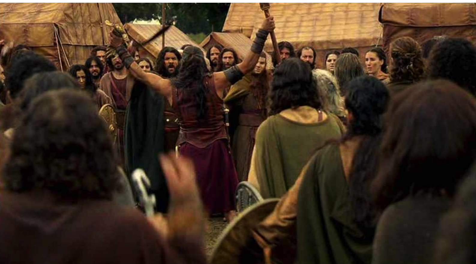
Hispania, la Leyenda : en chantant avec ses hommes.