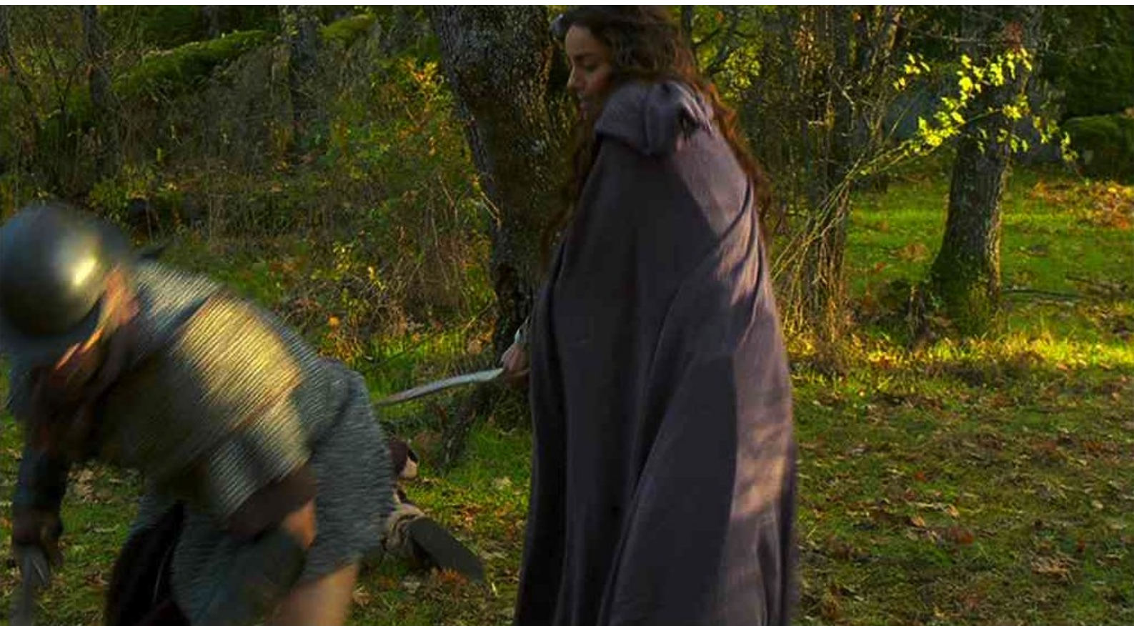
Hispania, la Leyenda : Le combat continuant, Navia blesse un légionnaire...