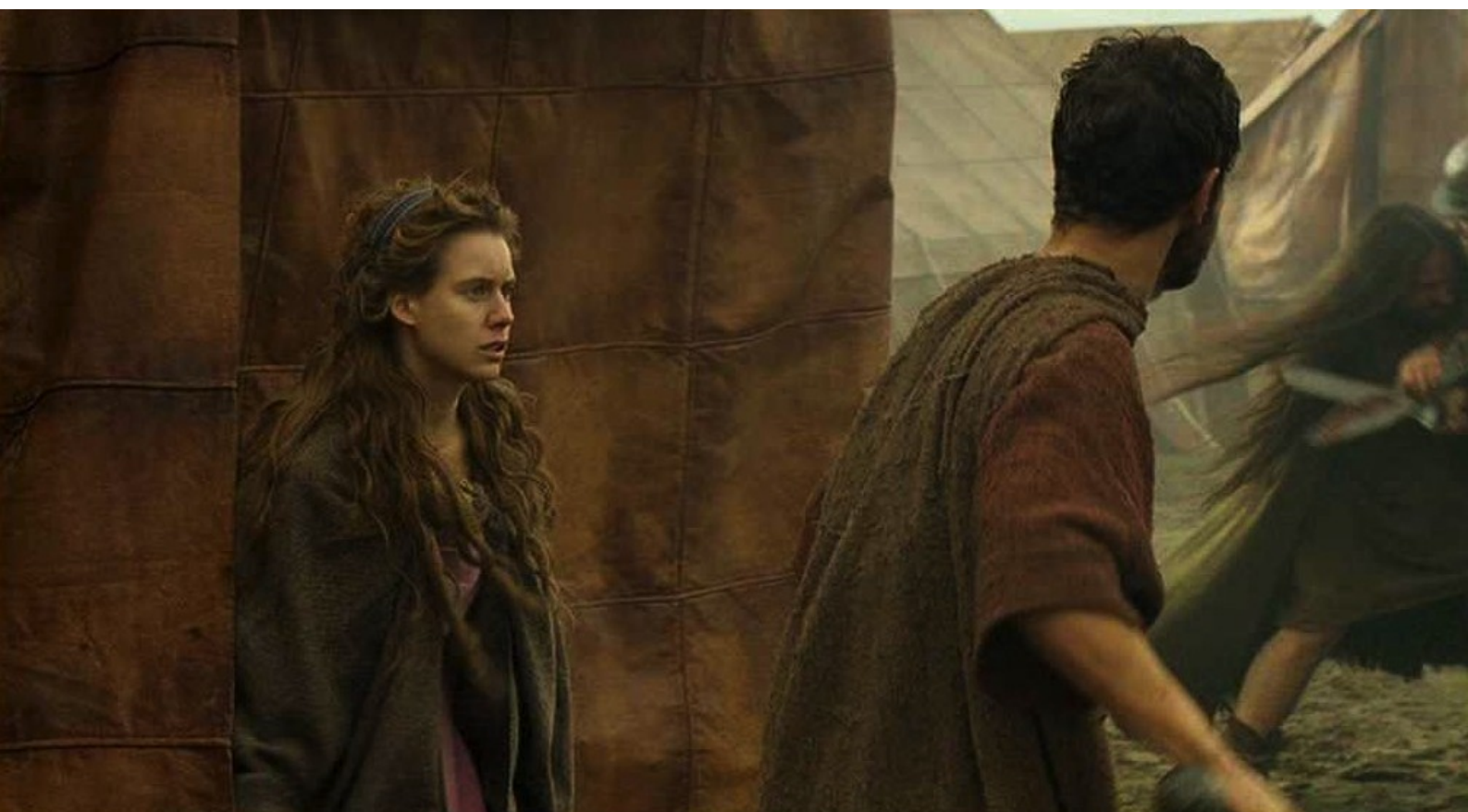
Hispania, la Leyenda : aidée par Hector, elle le libère, et ils fuient tous trois à travers le camp ;