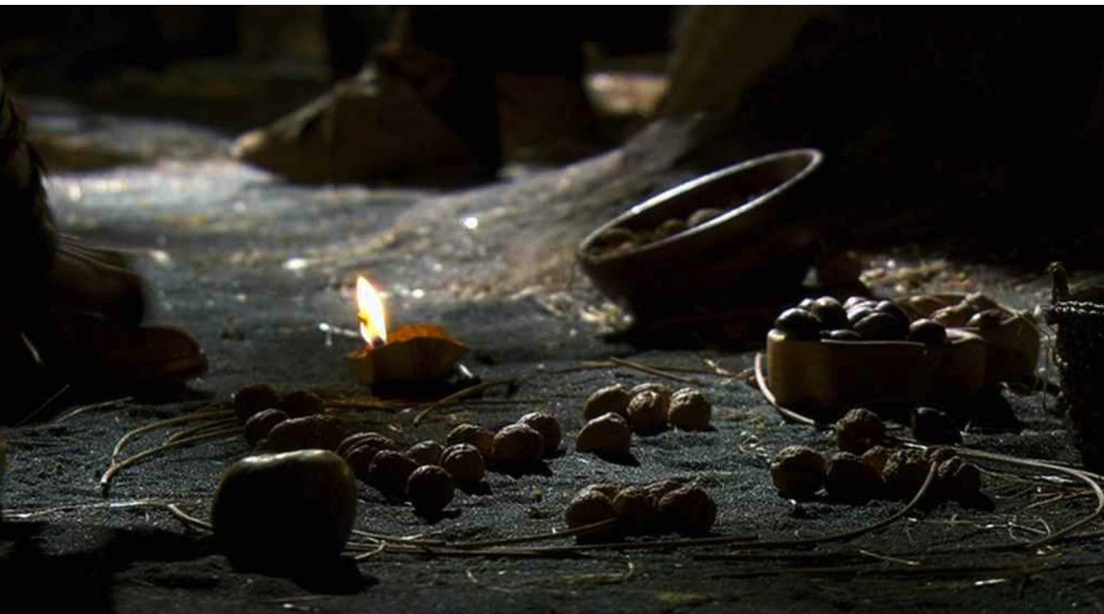
Hispania, la Leyenda : À l'aide de noix, les Lusitaniens préparent leur stratégie :