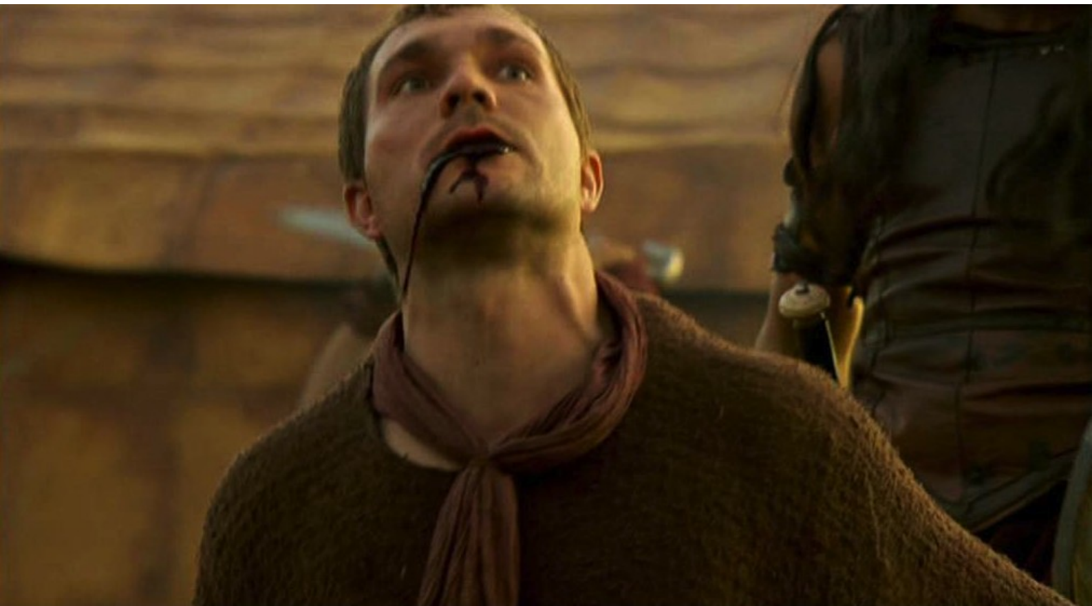
Hispania, la Leyenda : chez les Romains...