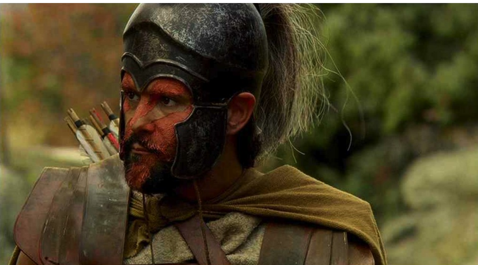
Hispania, la Leyenda : se casque...