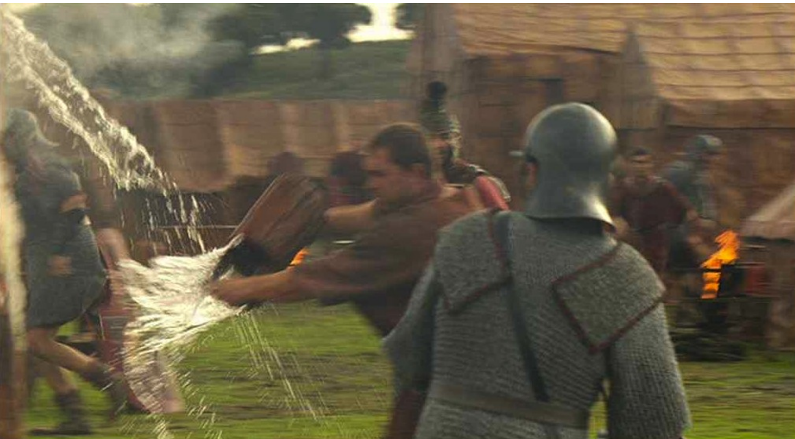
Hispania, la Leyenda : et que les soldats soient occupés à lutter contre les flammes.