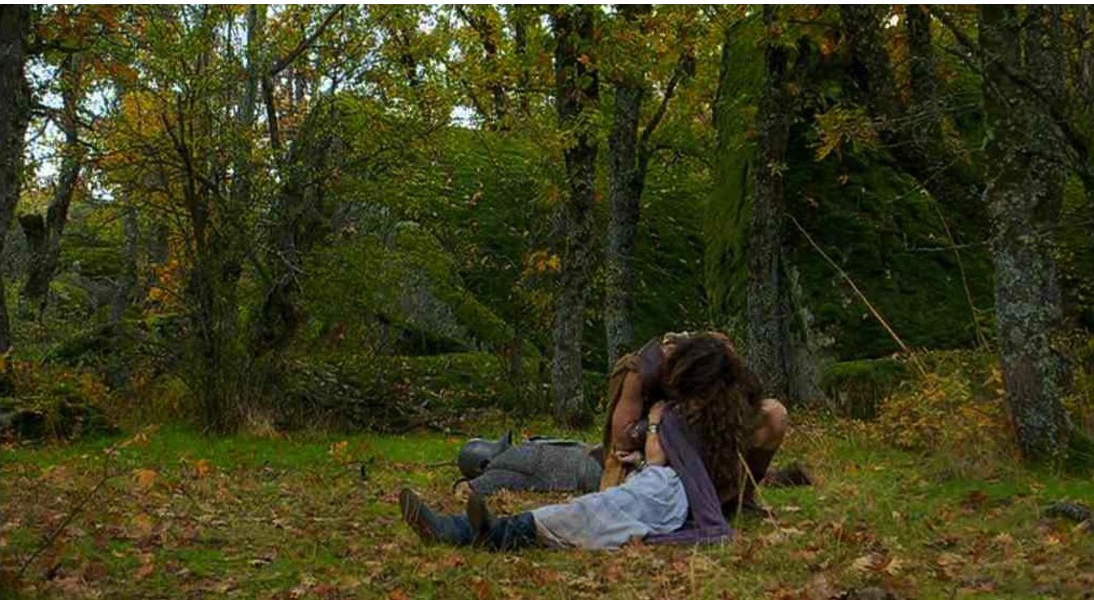
Hispania, la Leyenda : et meurt dans les bras de Dario,