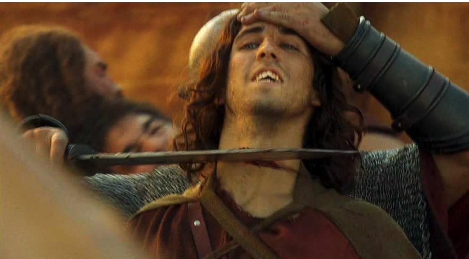
Hispania, la Leyenda : avec son lot de morts...