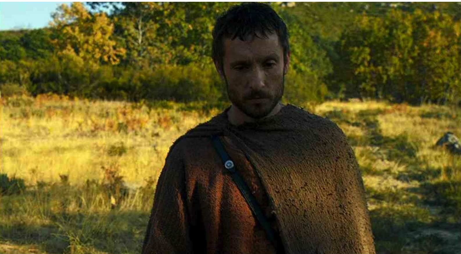
Hispania, la Leyenda : Entre-temps, Hector, errant perturbé à l'idée de devoir tuer Viriate,