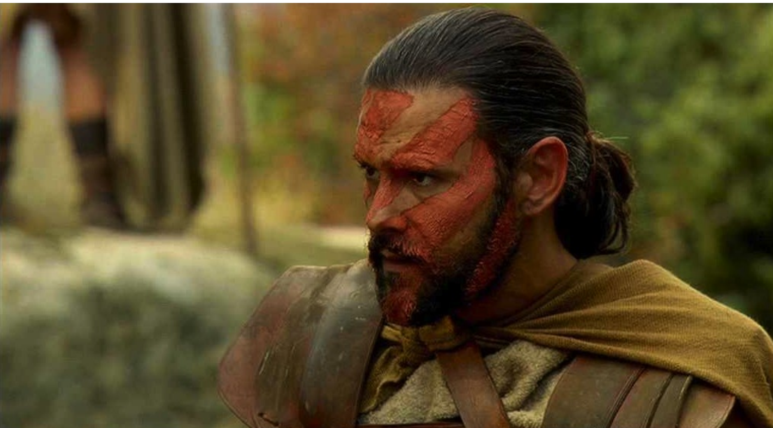
Hispania, la Leyenda : Viriate se grime,