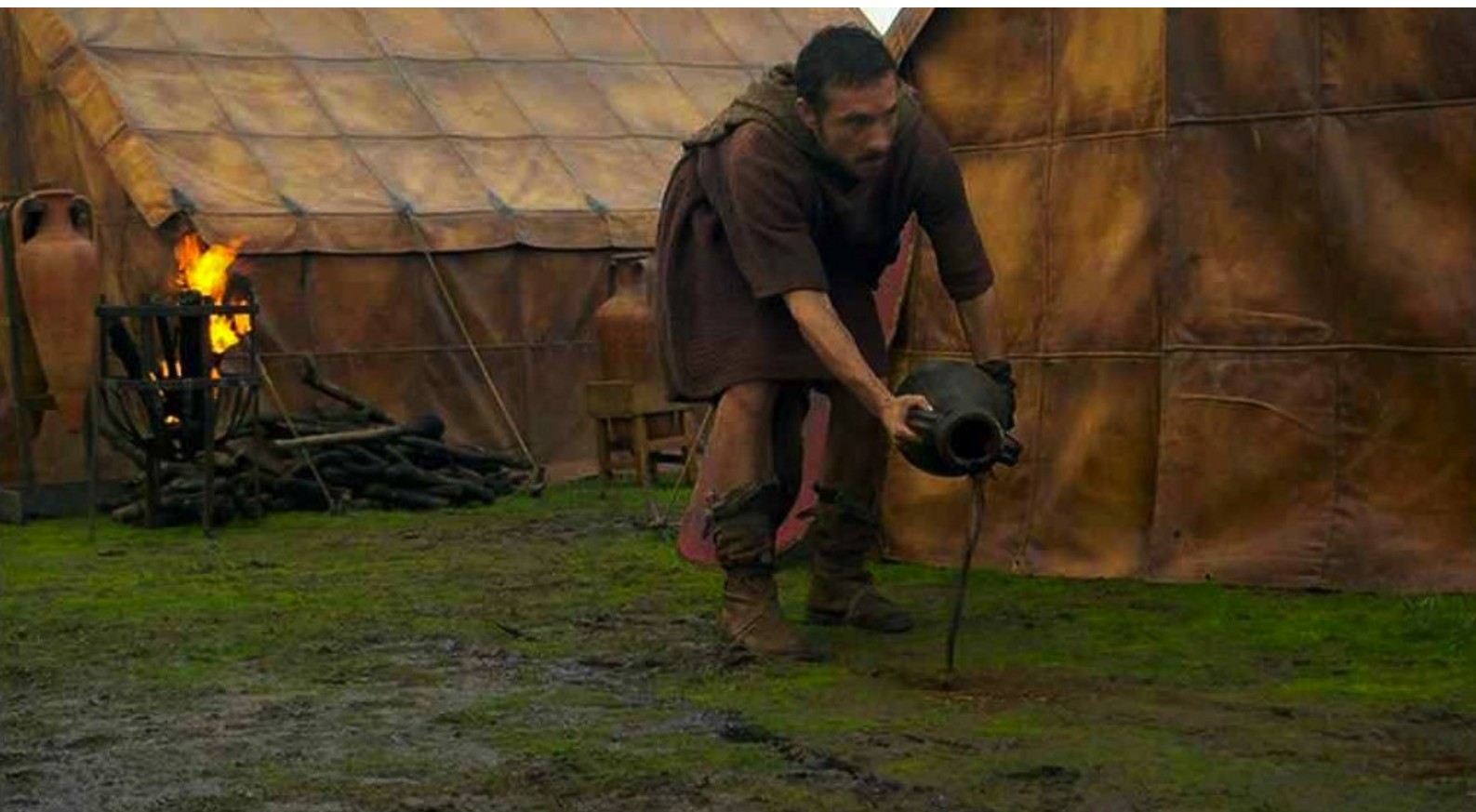
Hispania, la Leyenda : ensuite, il verse un liquide inflammable...