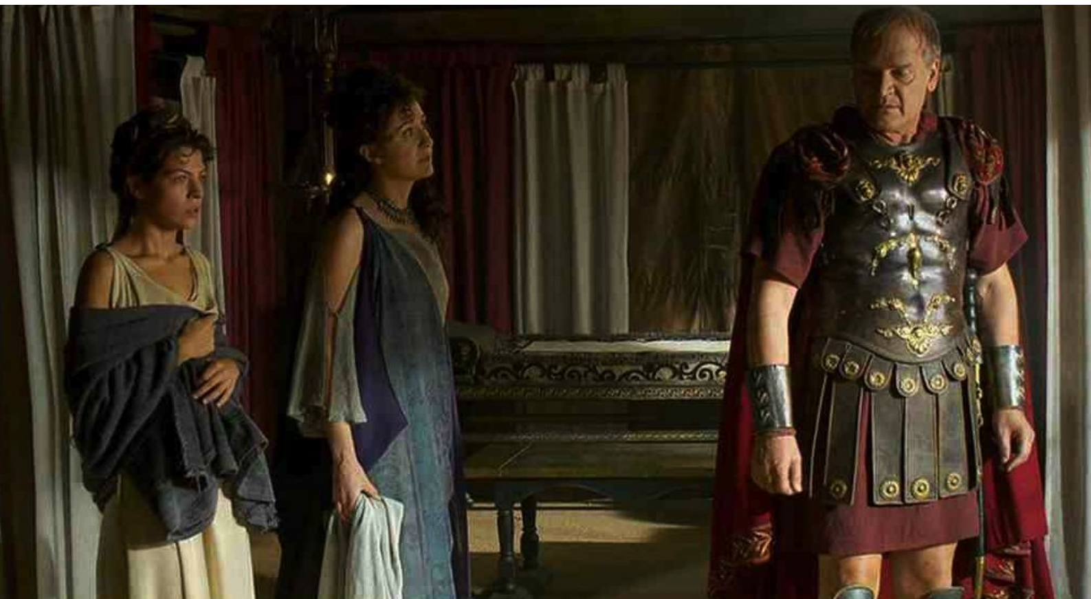
Hispania, la Leyenda : mais, lorsque Gaia et Claudia sont arrivées,