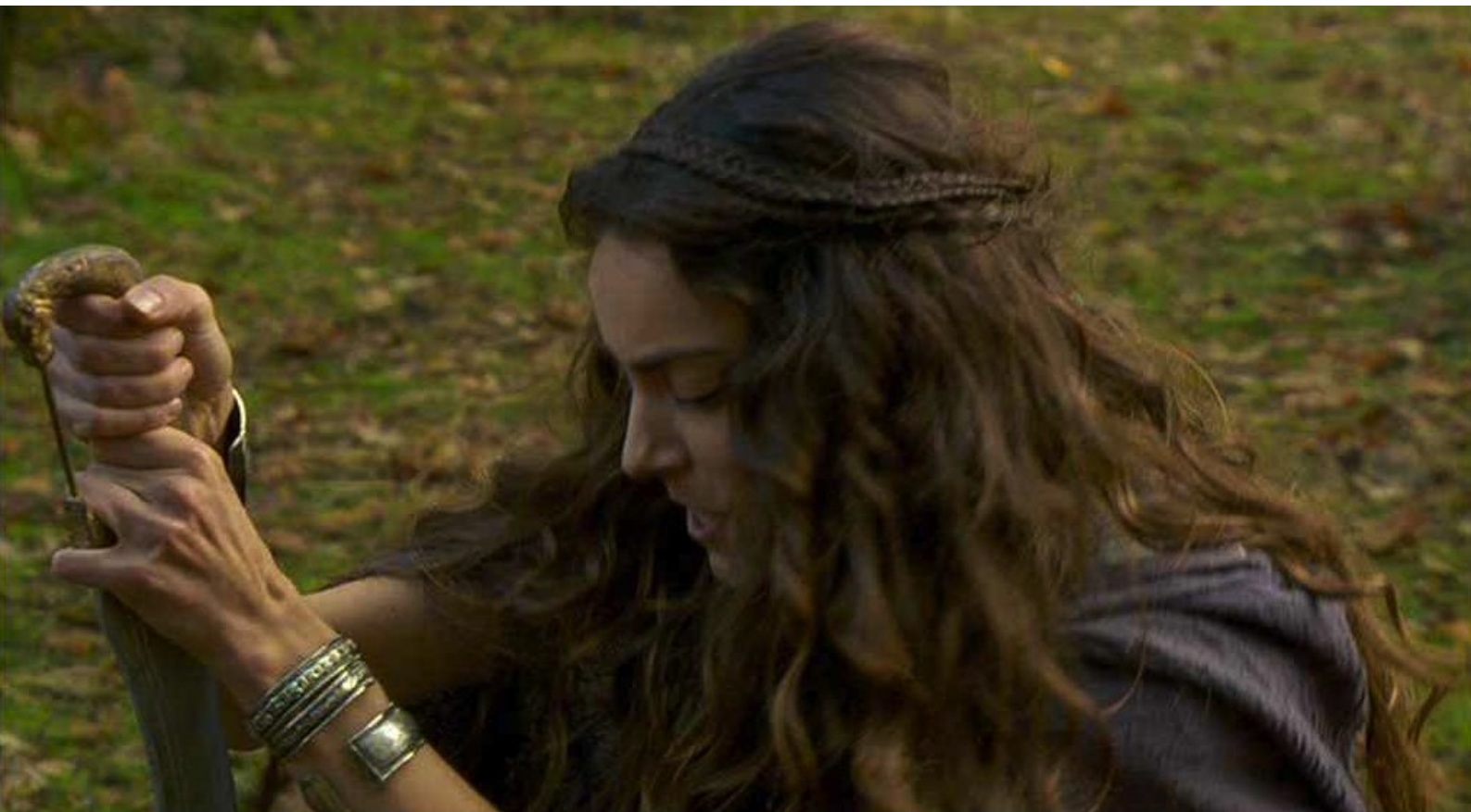
Hispania, la Leyenda : puis l'achève,