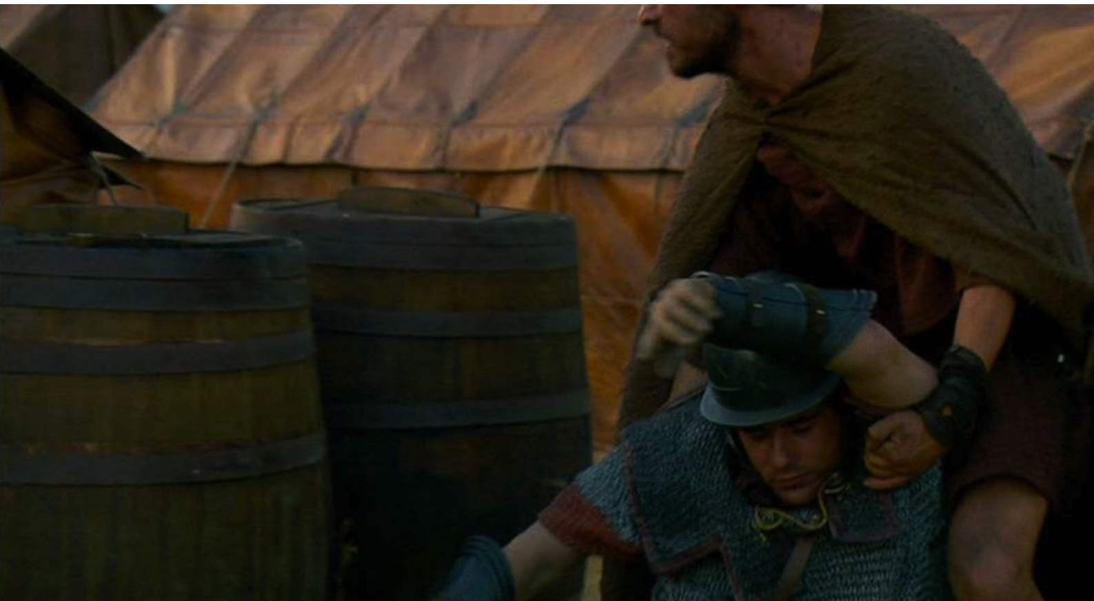
Hispania, la Leyenda : puis il dissimule son cadavre ;