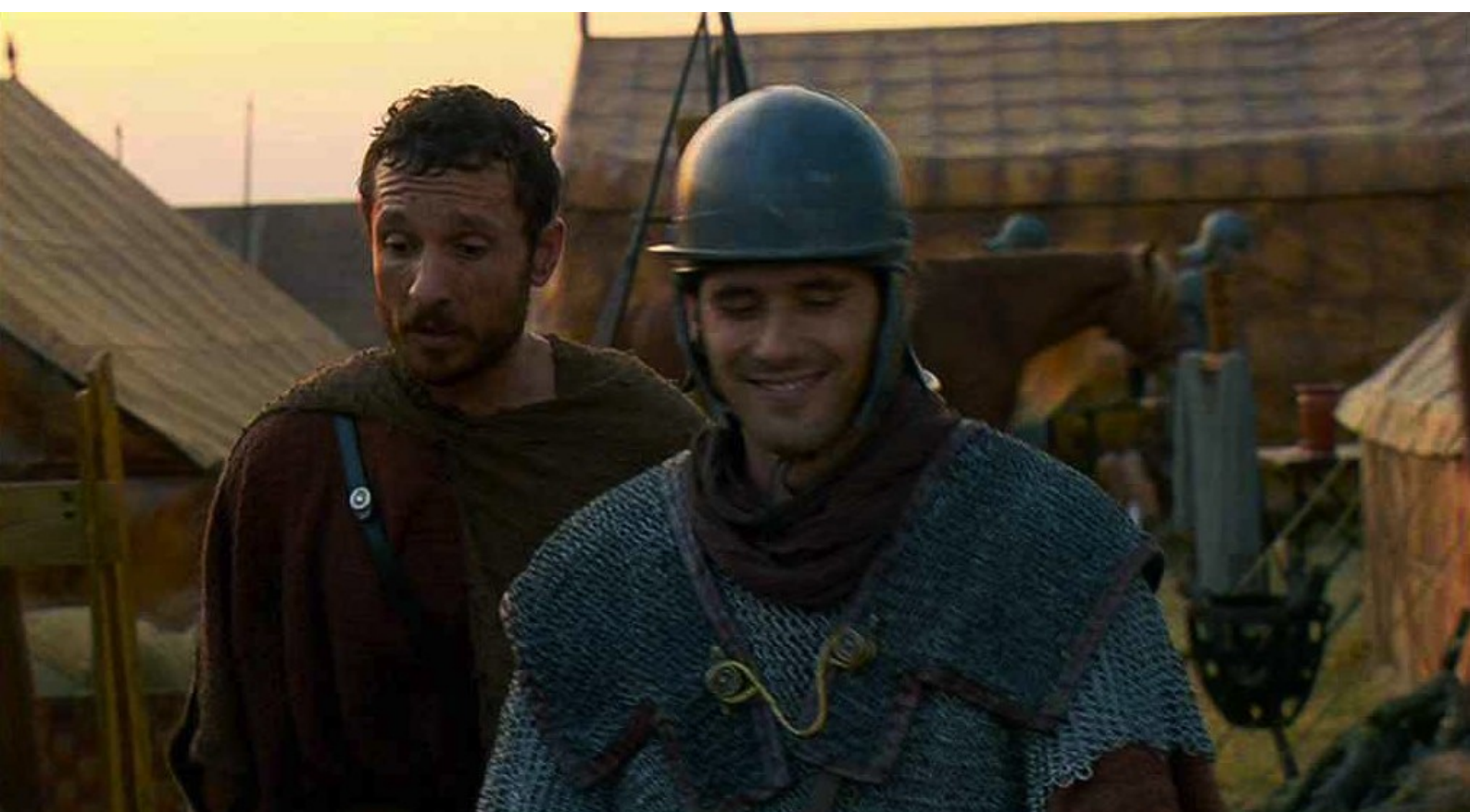
Hispania, la Leyenda : il s'approche discrètement du soldat qui l'escorte...