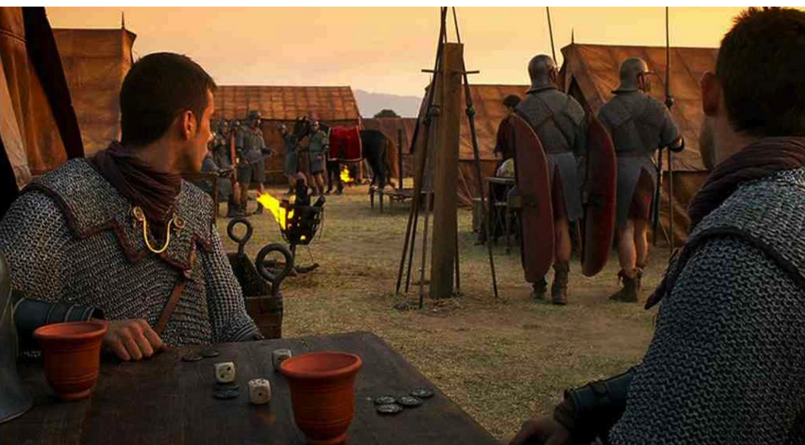
Hispania, la Leyenda : dont les soldats entendent les cris dans tout le camp.