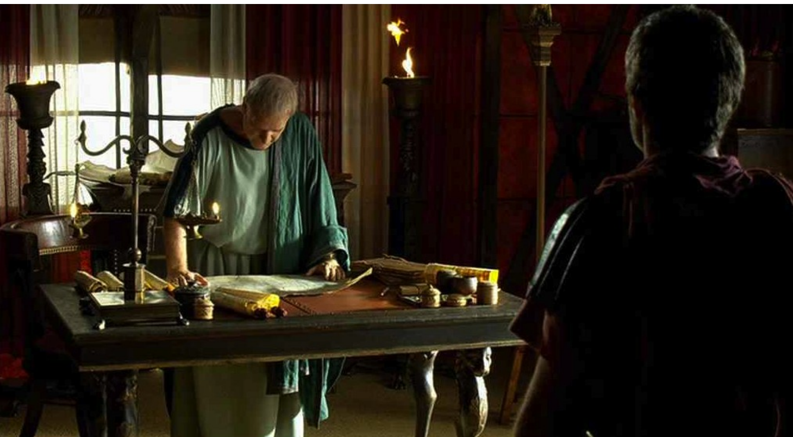
Hispania, la Leyenda : ce message dit que Viriate veut se rendre.