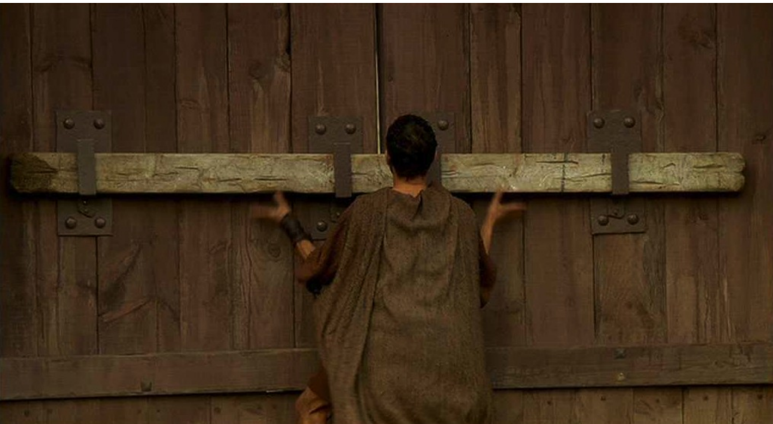
Hispania, la Leyenda : et va ôter la traverse qui ferme la porte du camp ;