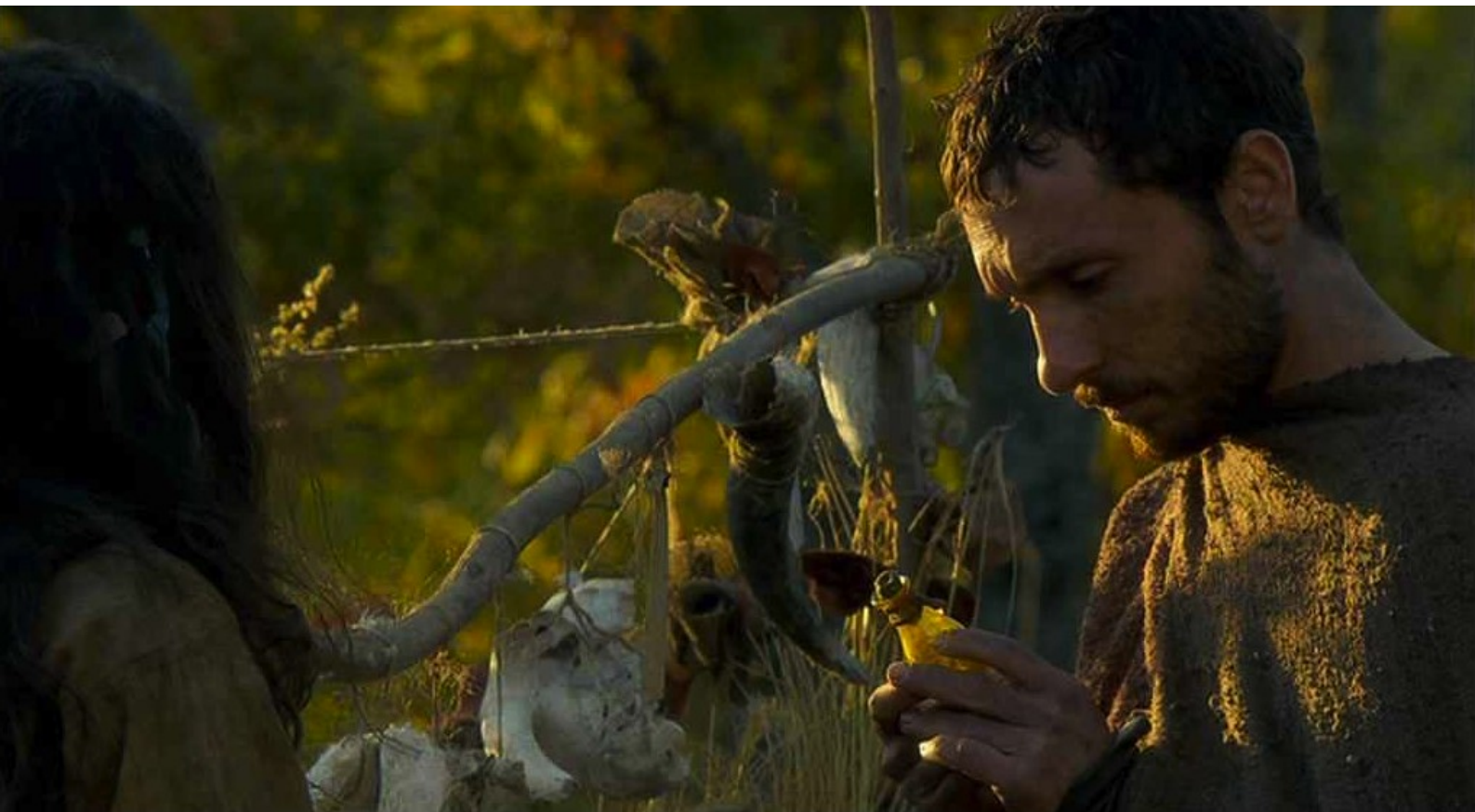
Hispania, la Leyenda : qui lui vend un poison foudroyant...