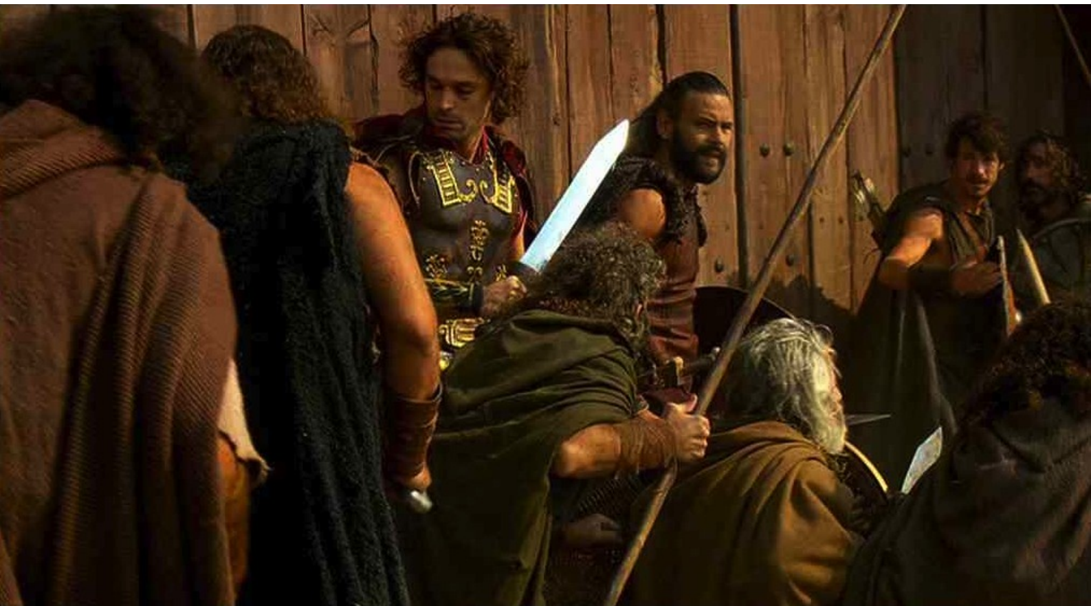
Hispania, la Leyenda : et s'agglutinent devant la porte du camp.