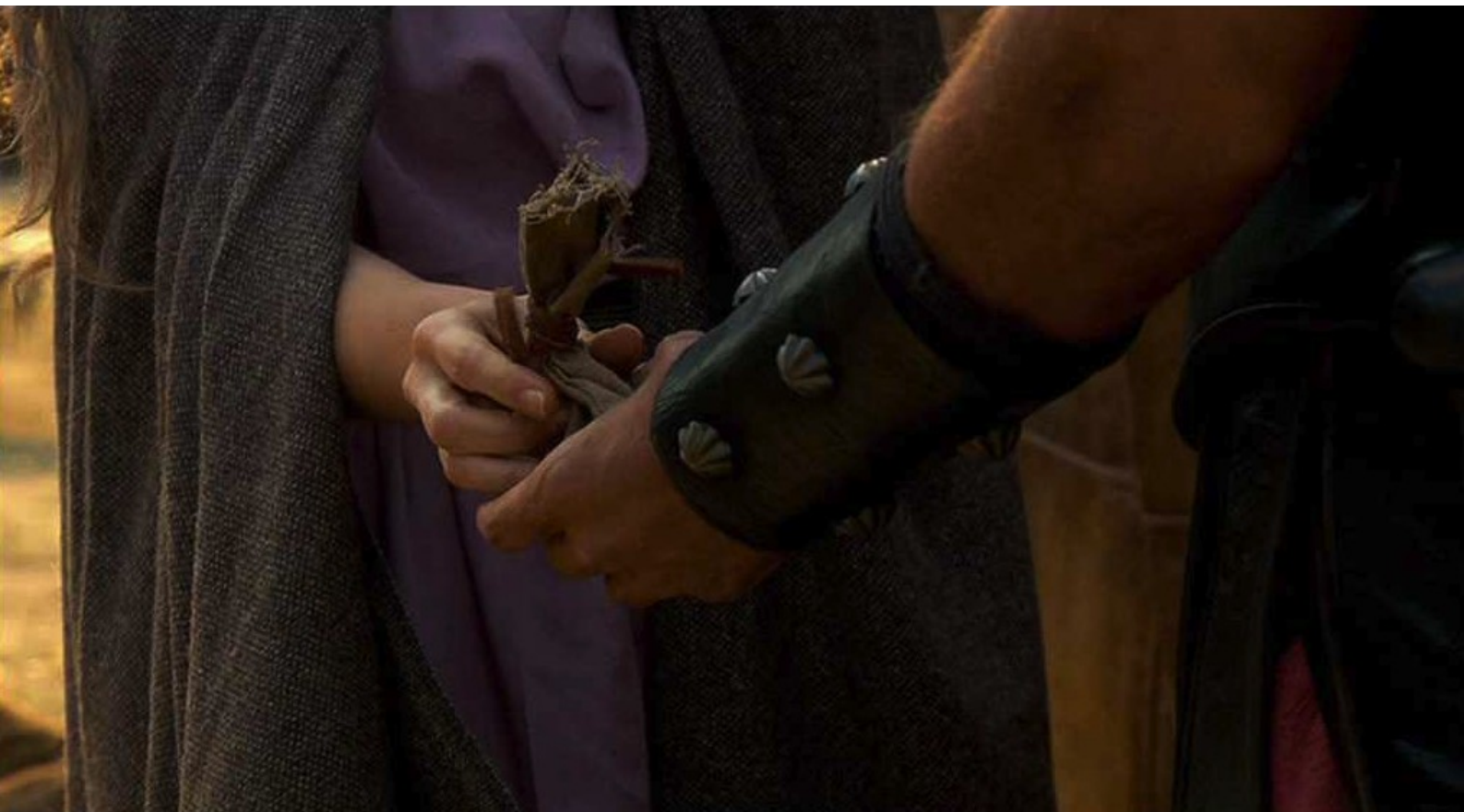
Hispania, la Leyenda : c'est pourquoi elle lui fournit des herbes abortives.