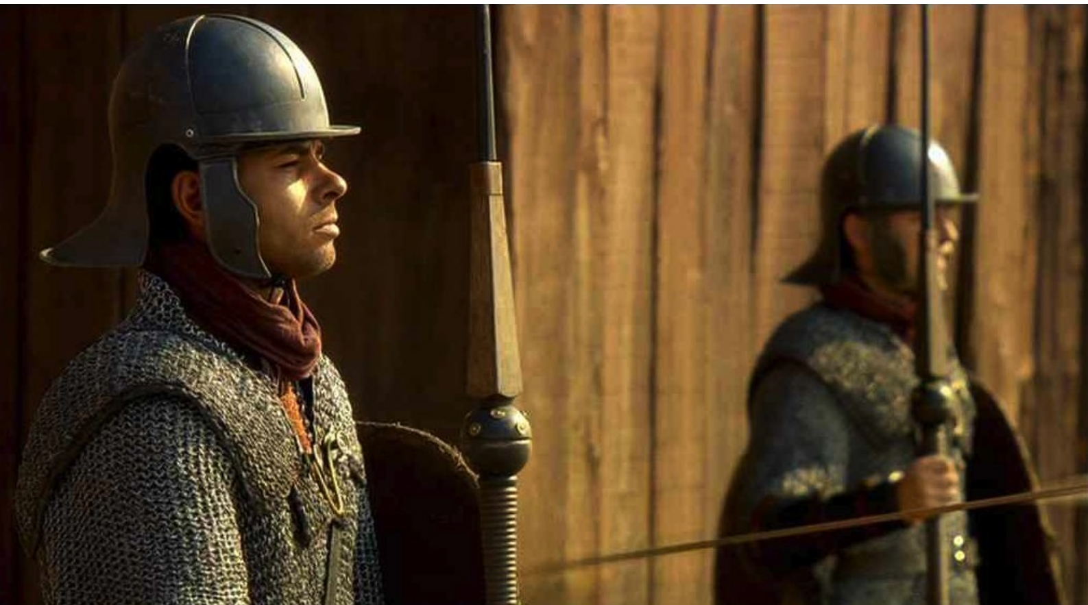
Hispania, la Leyenda : ils tirent une flèche contre une des deux sentinelles,