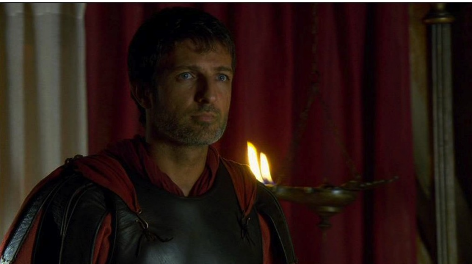
Hispania, la Leyenda : puis il demande à Marco,