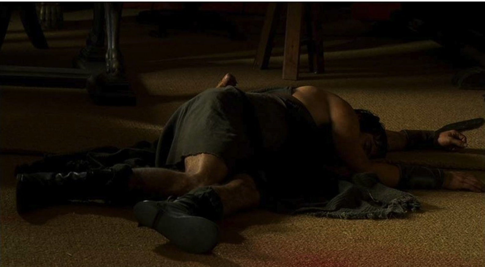
Hispania, la Leyenda : assomme par derrière le jeune Espagnol.