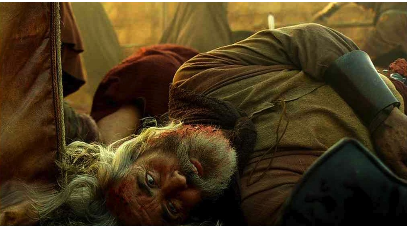
Hispania, la Leyenda : comme chez les assaillants.