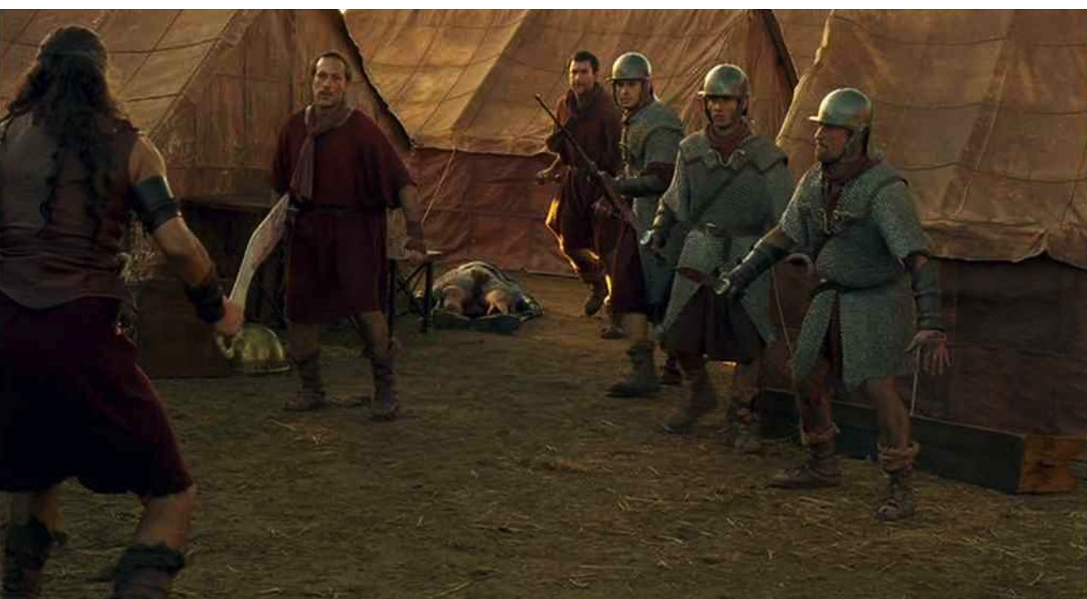
Hispania, la Leyenda : mettre en fuite cinq adversaires...