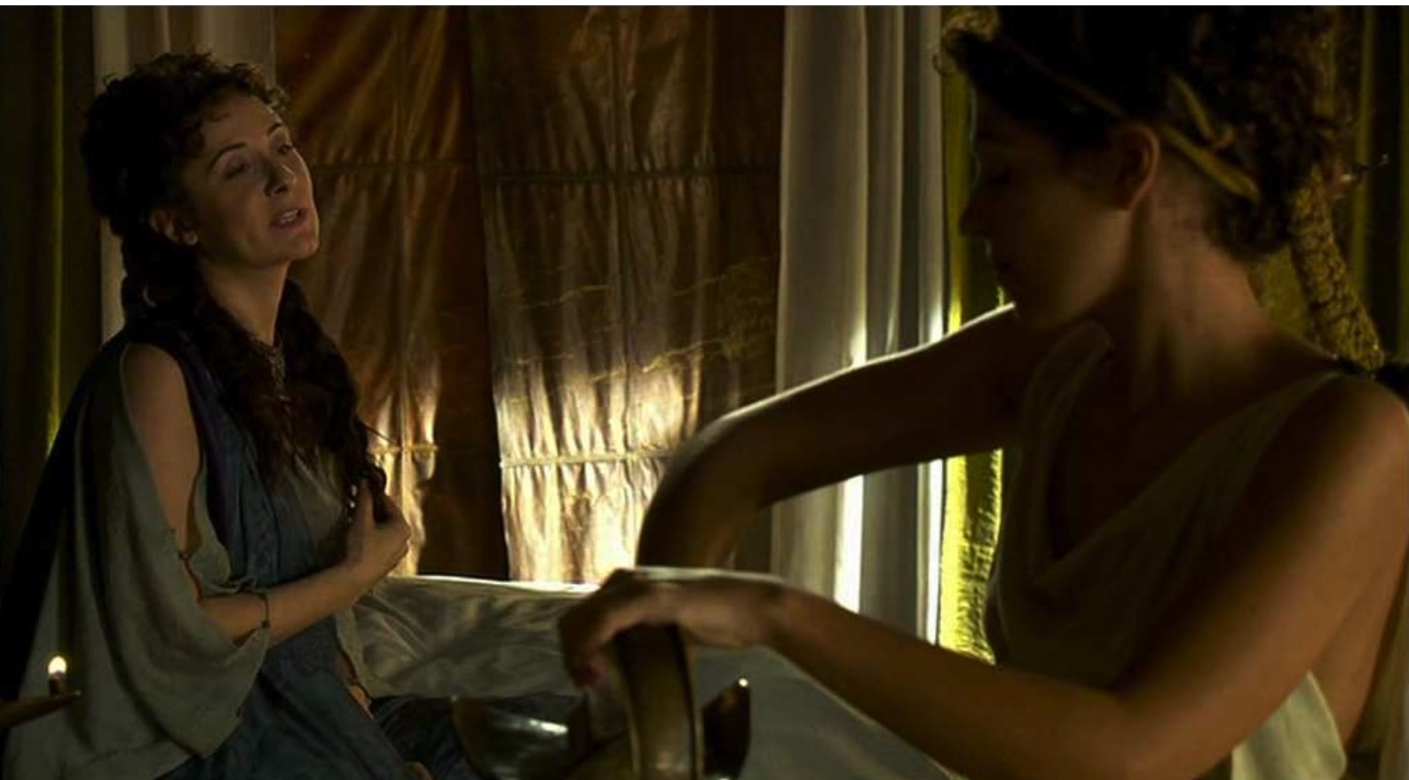
Hispania, la Leyenda : La patricienne dit à Gaia sa joie d'avoir un enfant de son mari,