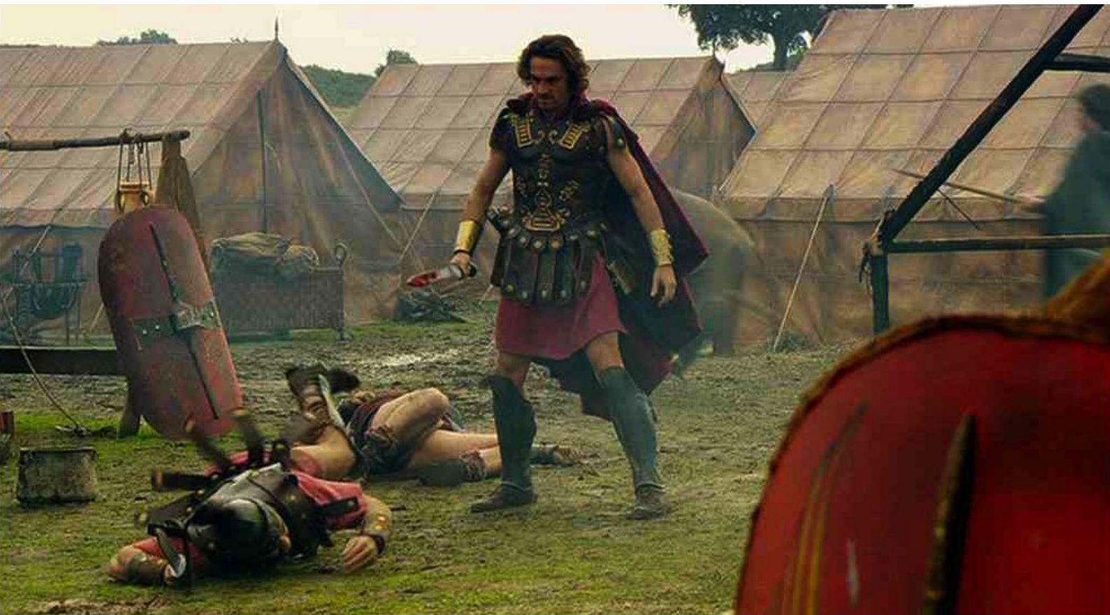
Hispania, la Leyenda : Même Fabio doit tuer des légionnaires,