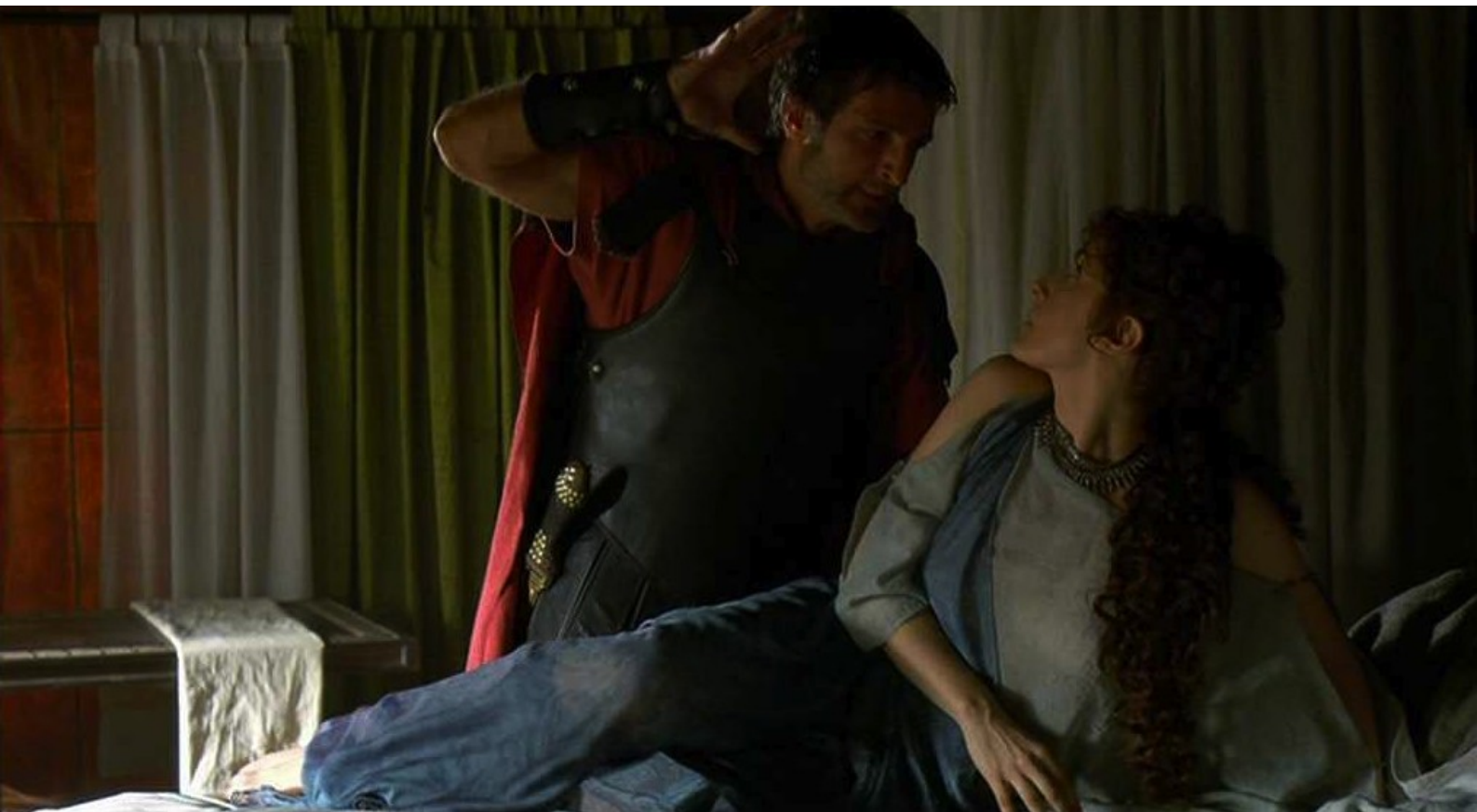
Hispania, la Leyenda : ce qui rend furieux Marco, le vrai père biologique du fœtus.