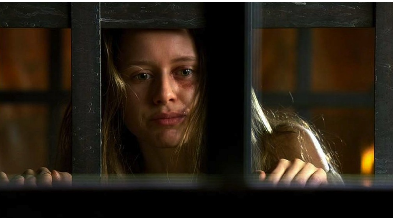
Hispania, la Leyenda : et jetée en cage.