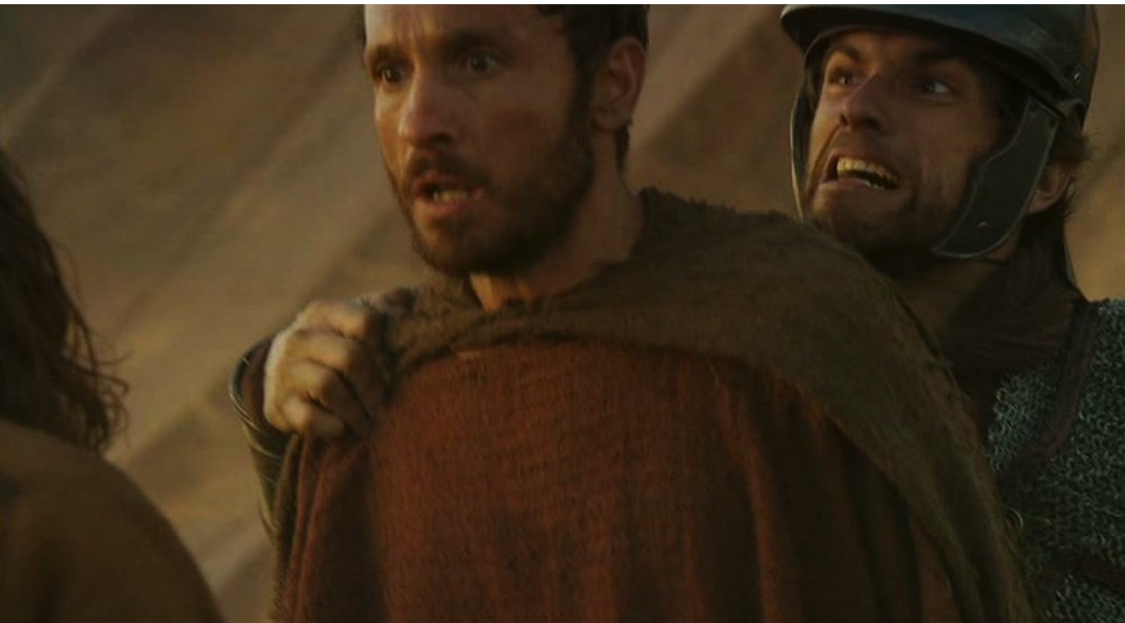
Hispania, la Leyenda : mais, dans le combat, Hector est transpercé par derrière...