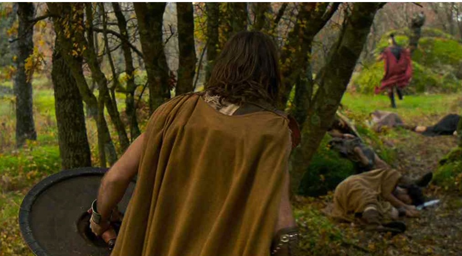
Hispania, la Leyenda : tandis que Marco s'enfuit.