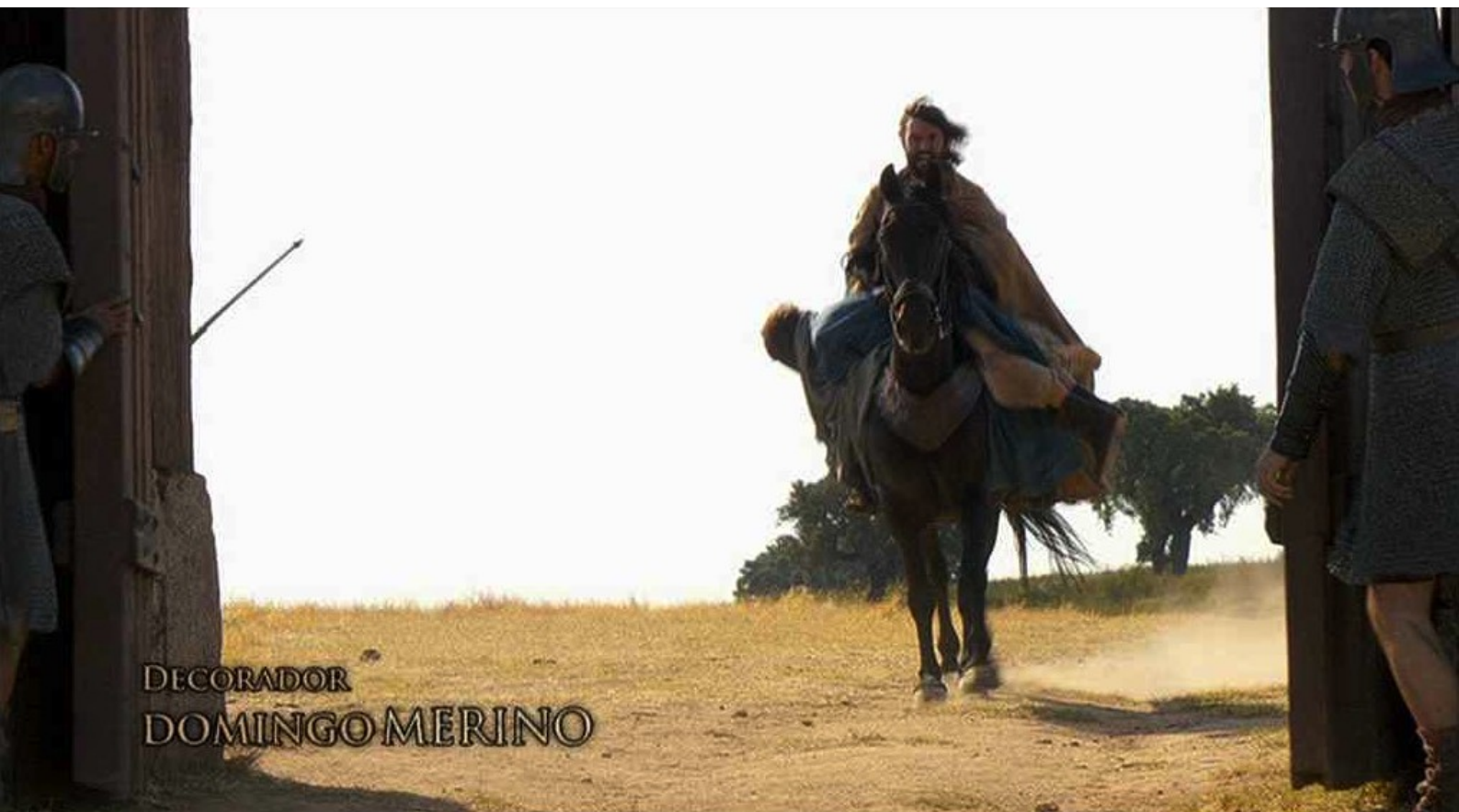
Hispania, la Leyenda : et se fait ouvrir la porte.