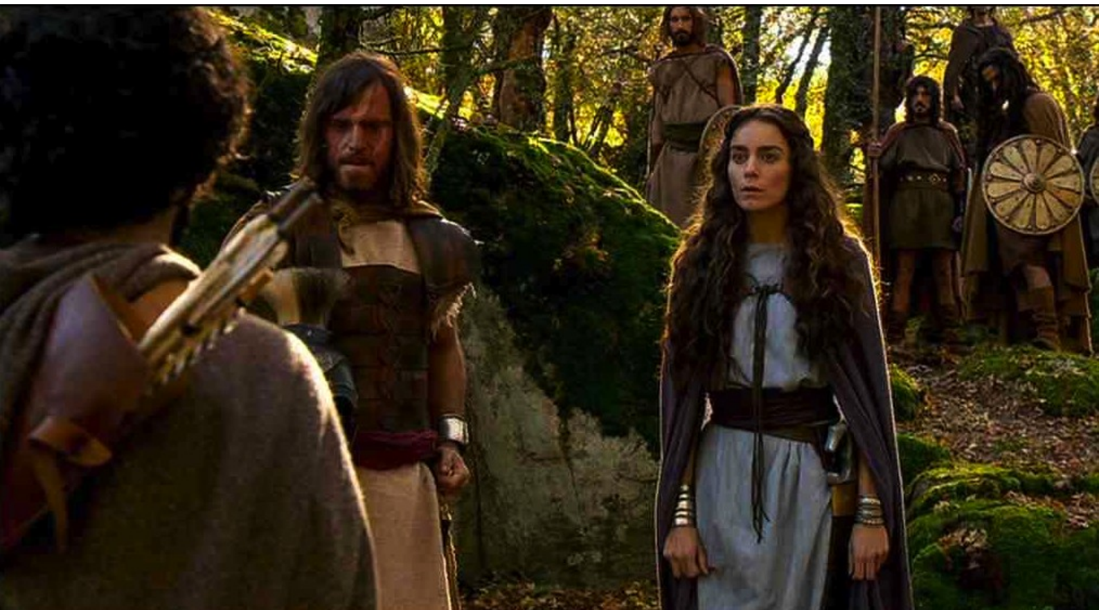
Hispania, la Leyenda : En réalité, Dario les attend, déguisé en Viriate,