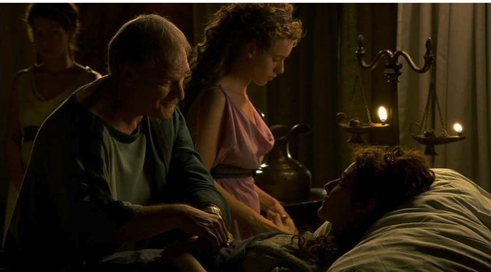
Hispania, la Leyenda : Helena en comprend la cause et annonce que Claudia est enceinte.