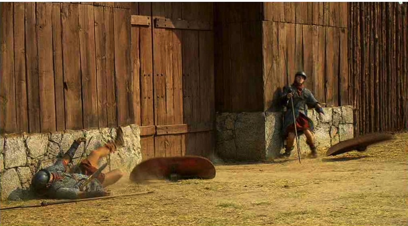
Hispania, la Leyenda : puis abattent la seconde