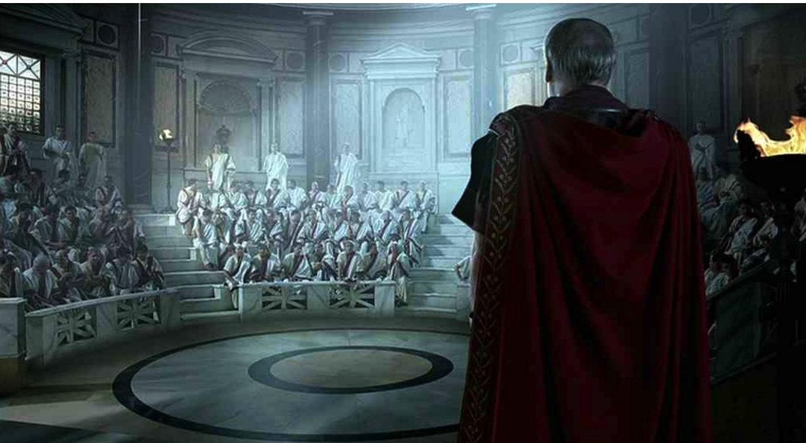
Hispania, la Leyenda : Galba doit se justifier en racontant dans un retour en arrière...