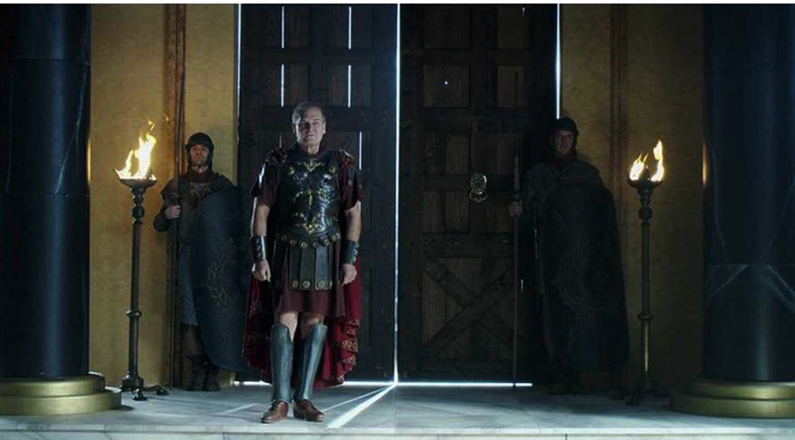
Hispania, la Leyenda : les ultimes épisodes de la guerre contre Viriate.