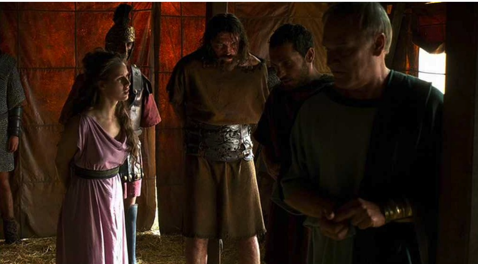
Hispania, la Leyenda : malgré les supplications d'Helena,