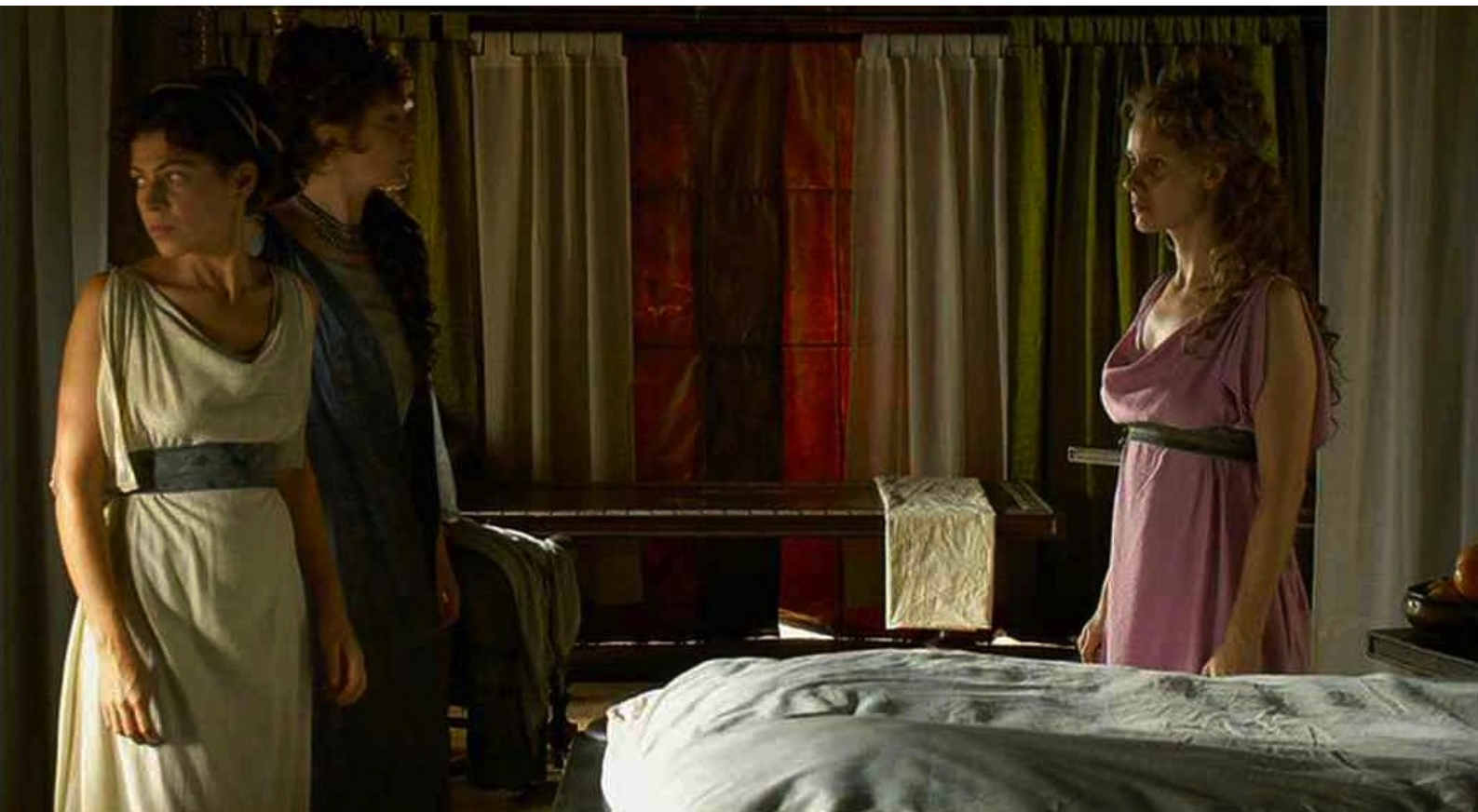
Hispania, la Leyenda : ordonne qu'on fasse venir les femmes auprès de lui,