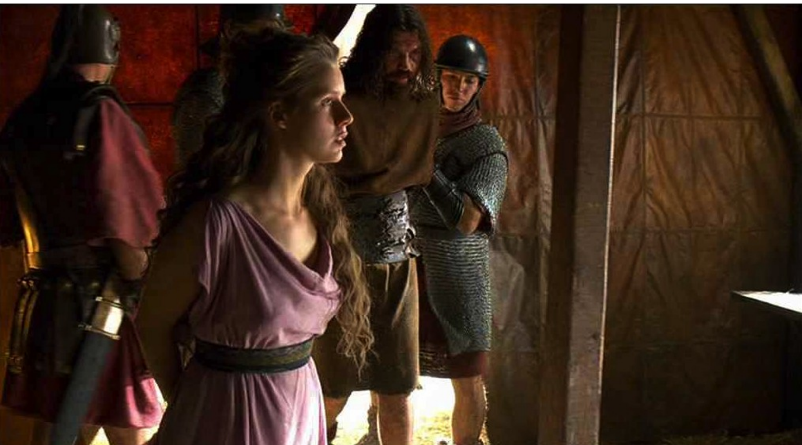
Hispania, la Leyenda : et Sandro,