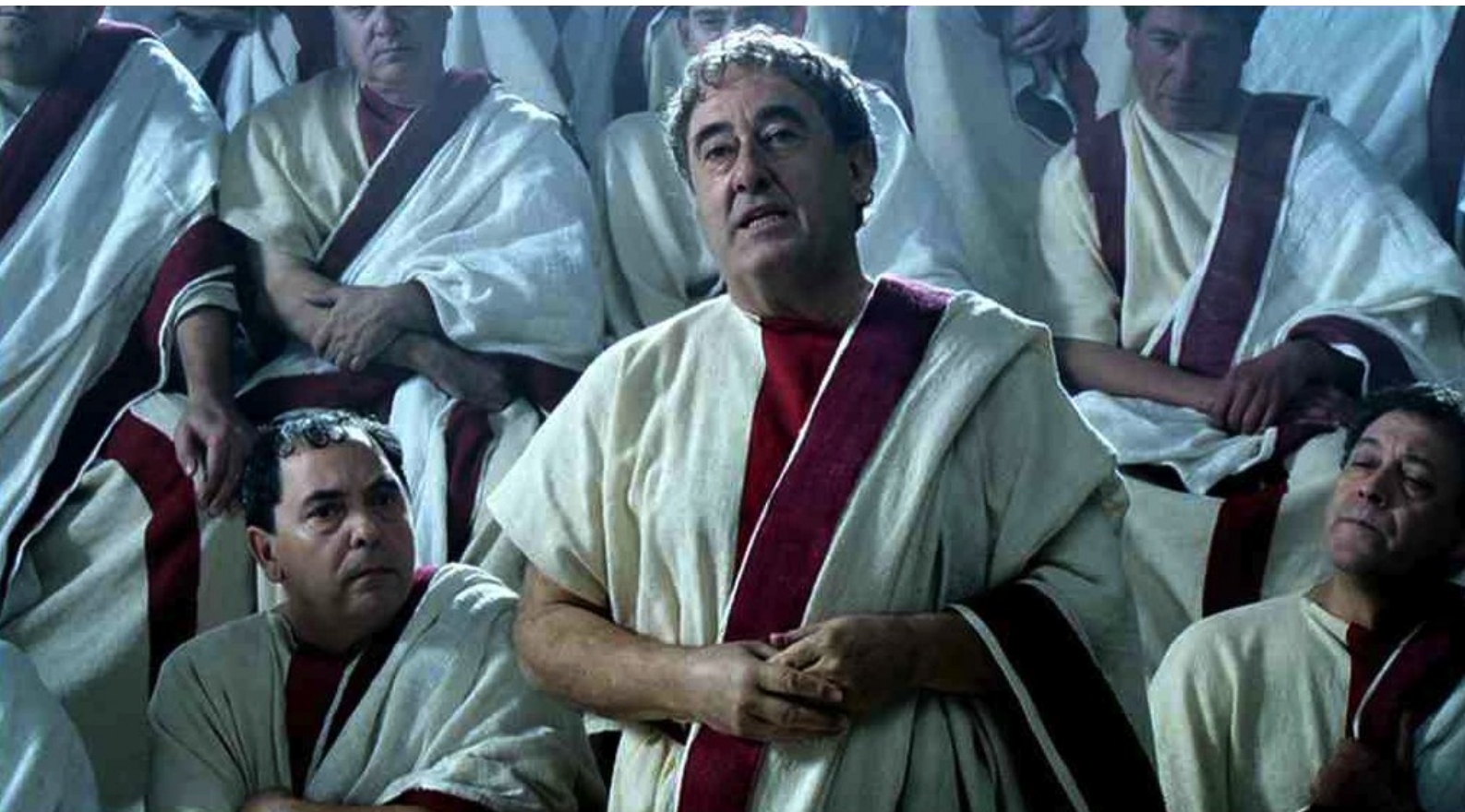
Hispania, la Leyenda : Interpellé par Caton l'Ancien devant le sénat romain,

Comme portfolios du numéro 46 de La 12 e Heure , nous vous offrons plusieurs florilèges de photos tirées des épisodes de la série Hispania, la Leyenda , à laquelle nous avons consacré presque tout le numéro 46 de notre fanzine (captures d'écran de Claude Aubert).