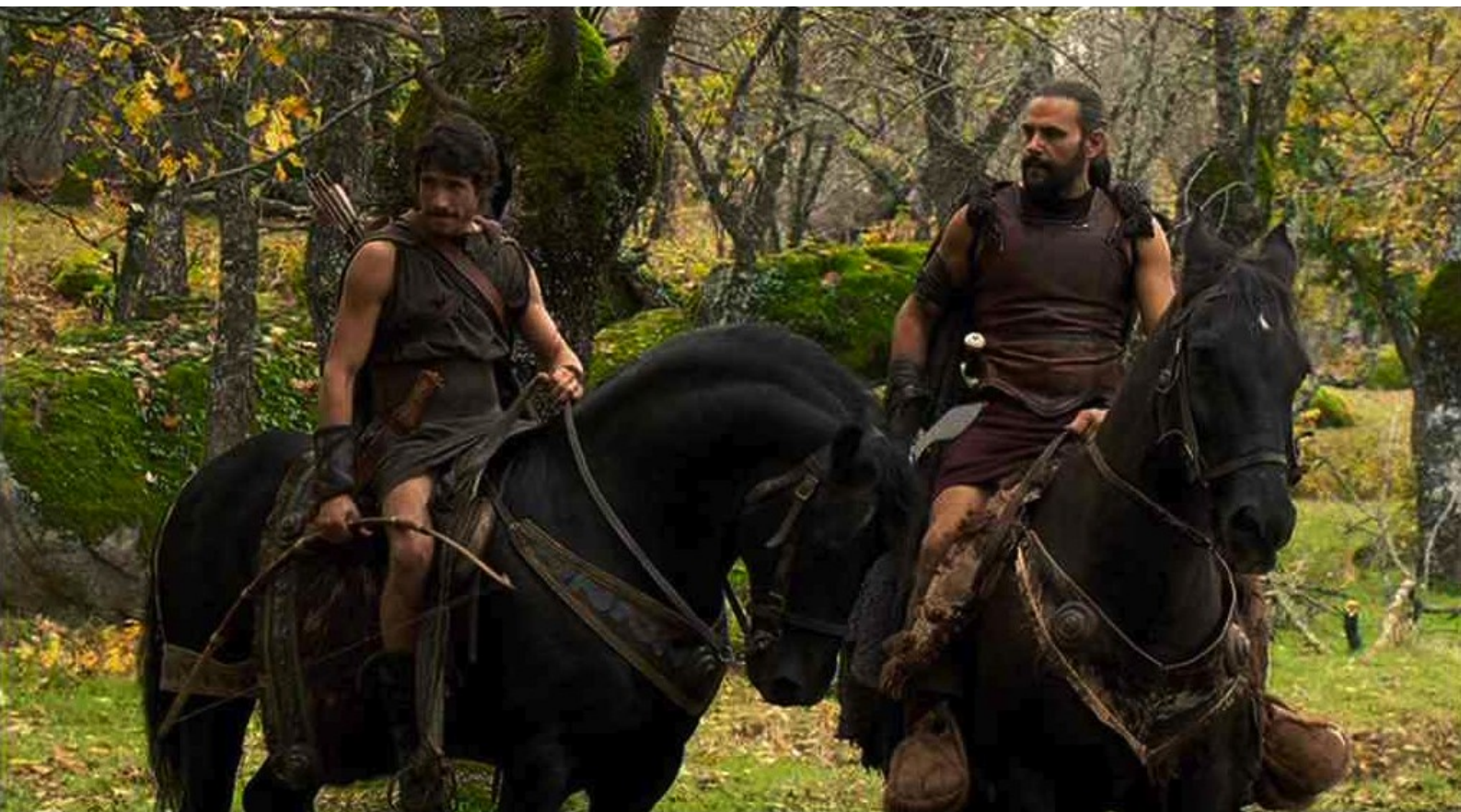
Hispania, la Leyenda : Après cet échec, Paulo et Viriate reviennent dépités,