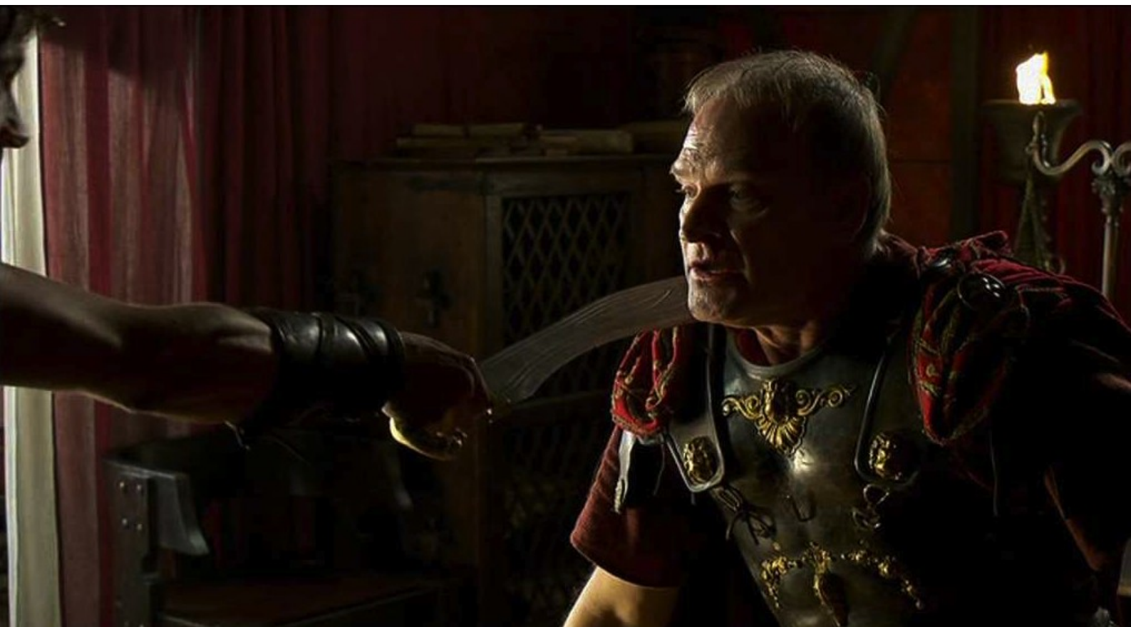
Hispania, la Leyenda : le vainc et le menace ;