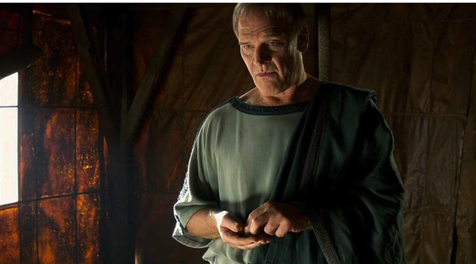
Hispania, la Leyenda : Quant à Galba, il est furieux quand il apprend l'échec d'Hector :