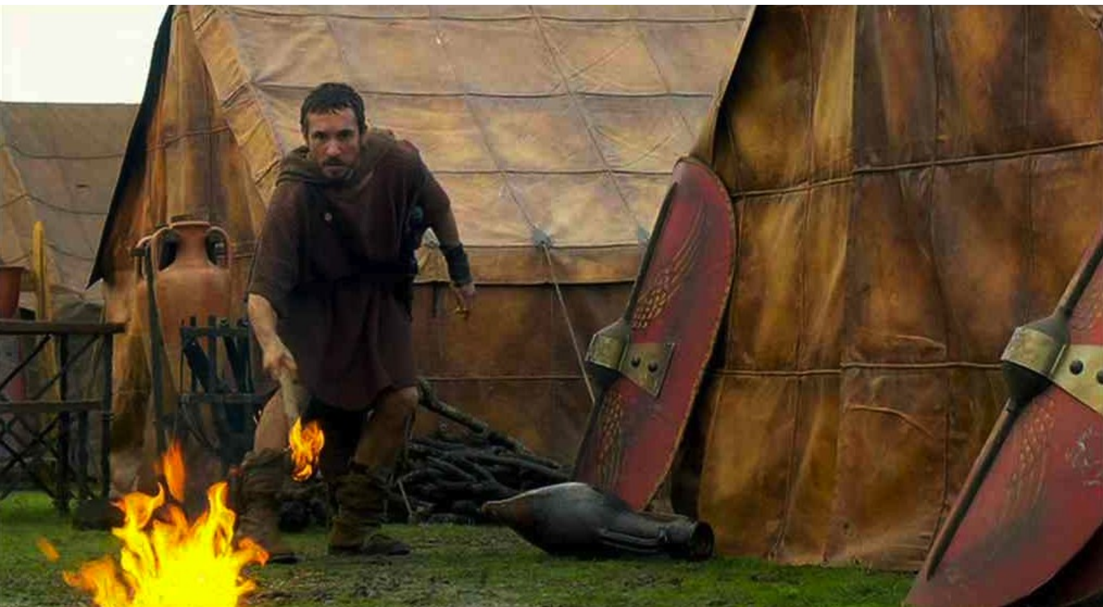
Hispania, la Leyenda : boute le feu...