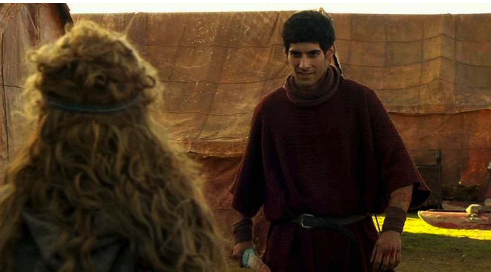
Hispania, la Leyenda : par un Romain...