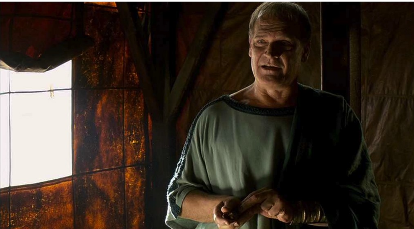
Hispania, la Leyenda : et leur annonce qu'Hector va tuer Viriate ;