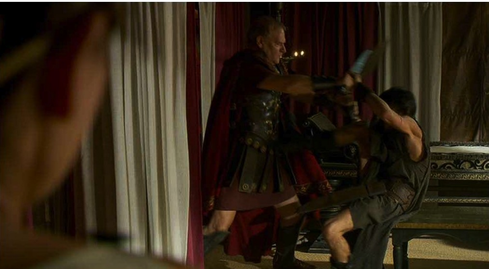
Hispania, la Leyenda : survient Paulo, qui assaille le préteur,