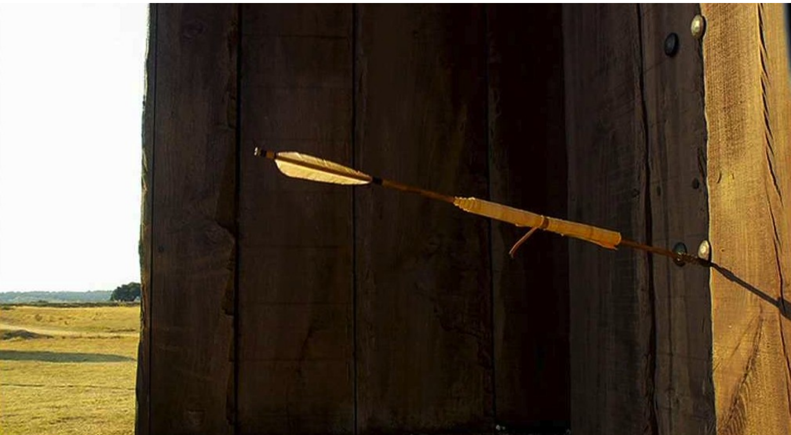
Hispania, la Leyenda : portant un message pour Galba :