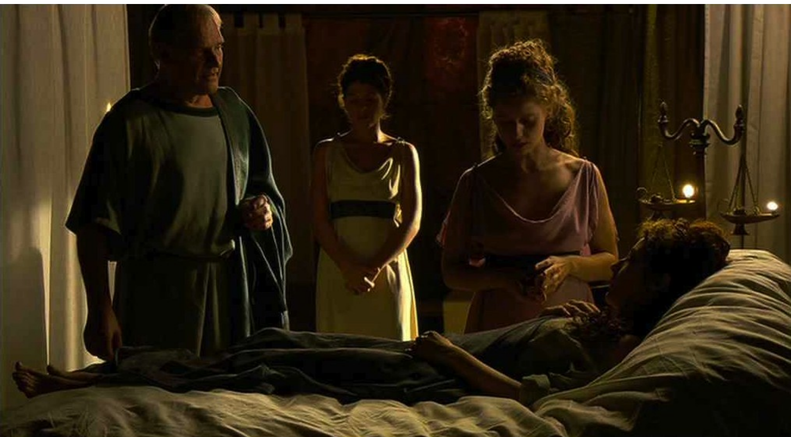
Hispania, la Leyenda : victime d'un évanouissement.