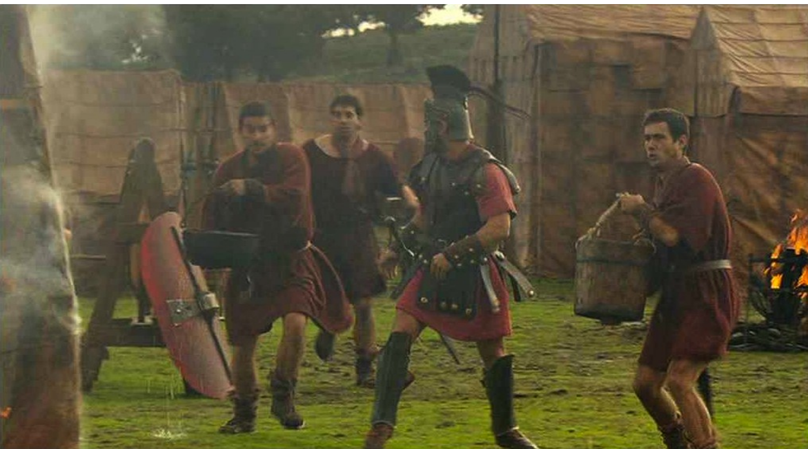
Hispania, la Leyenda : que la panique se propage...