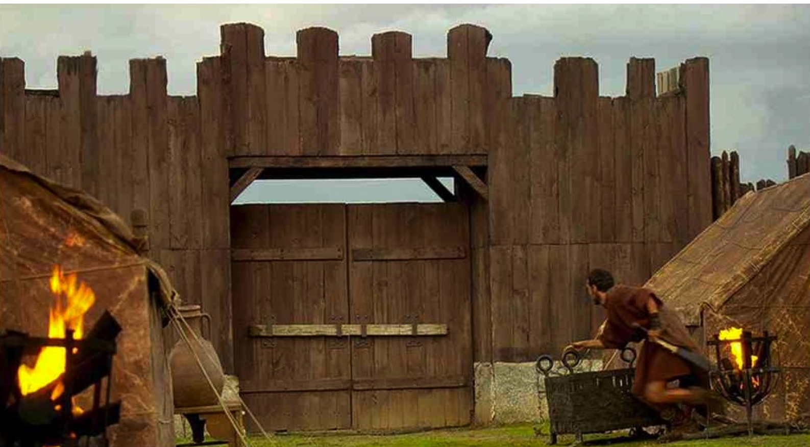
Hispania, la Leyenda : Hector se précipite alors...