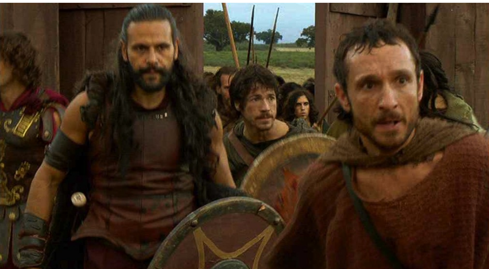
Hispania, la Leyenda : les Lusitaniens commencent à entrer prudemment,