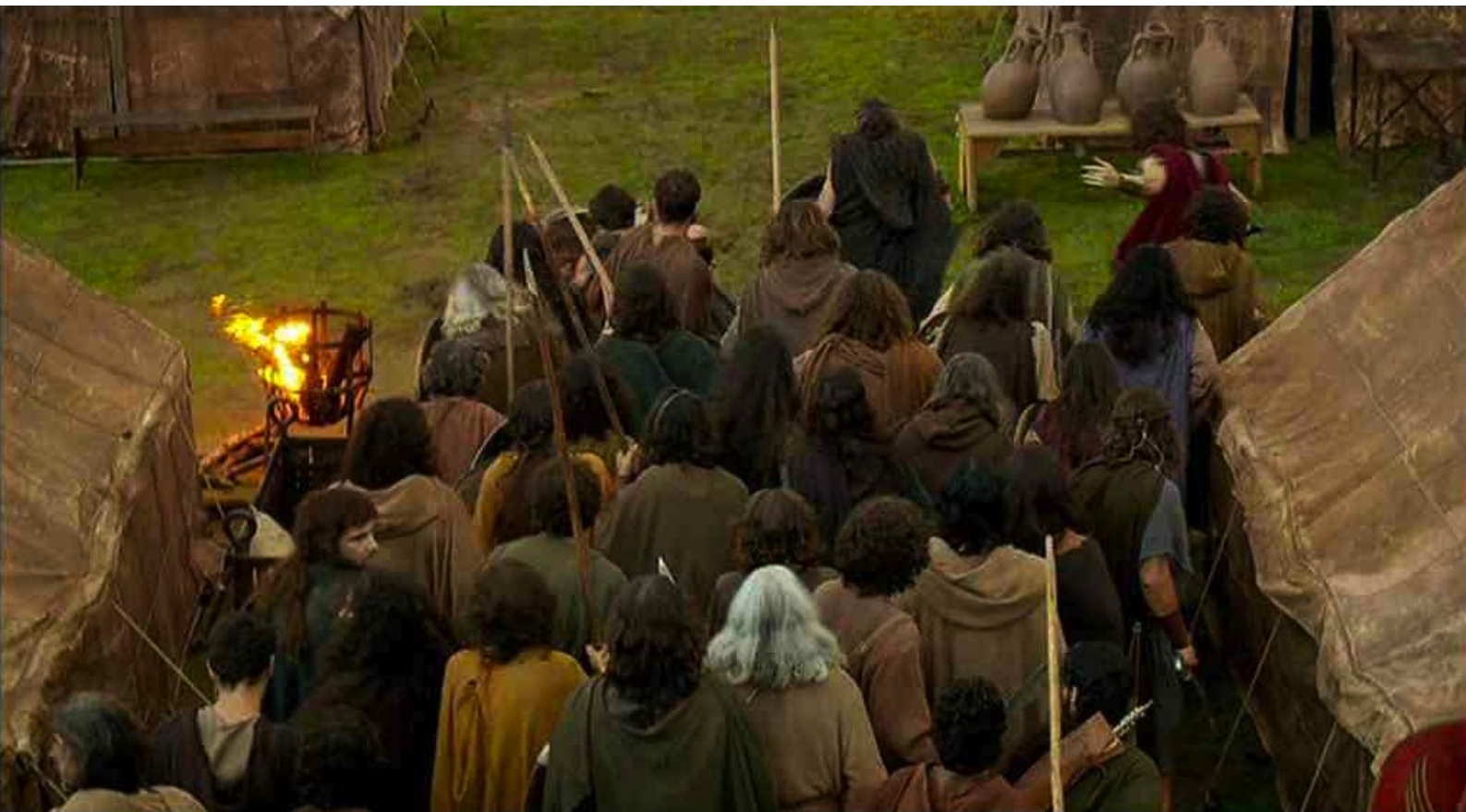
Hispania, la Leyenda : puis progressent entre les tentes,