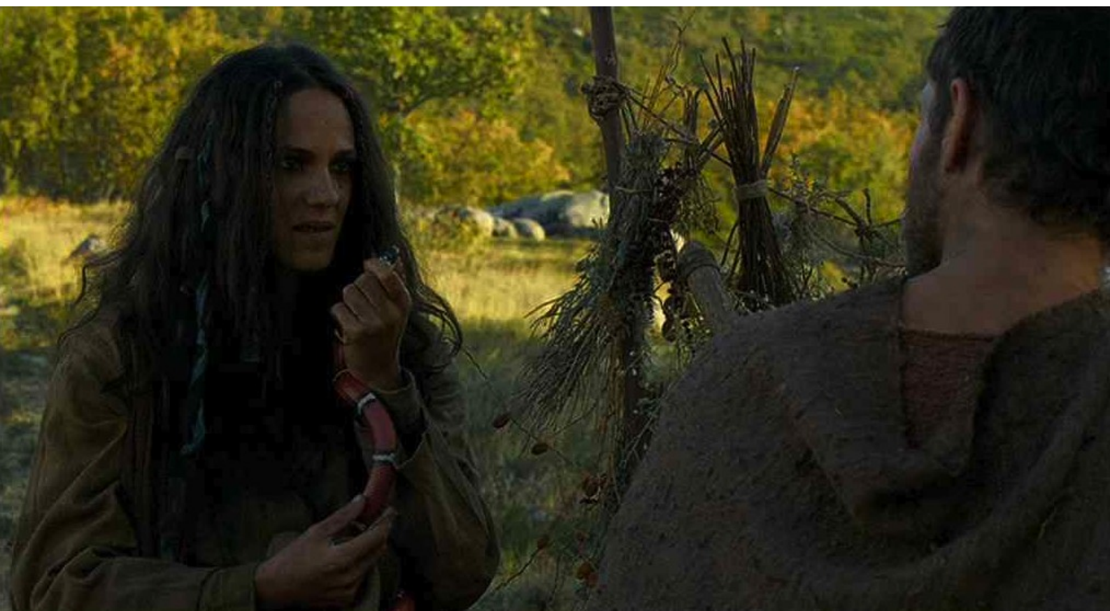
Hispania, la Leyenda : et un serpent venimeux pour tuer le chef des insurgés.