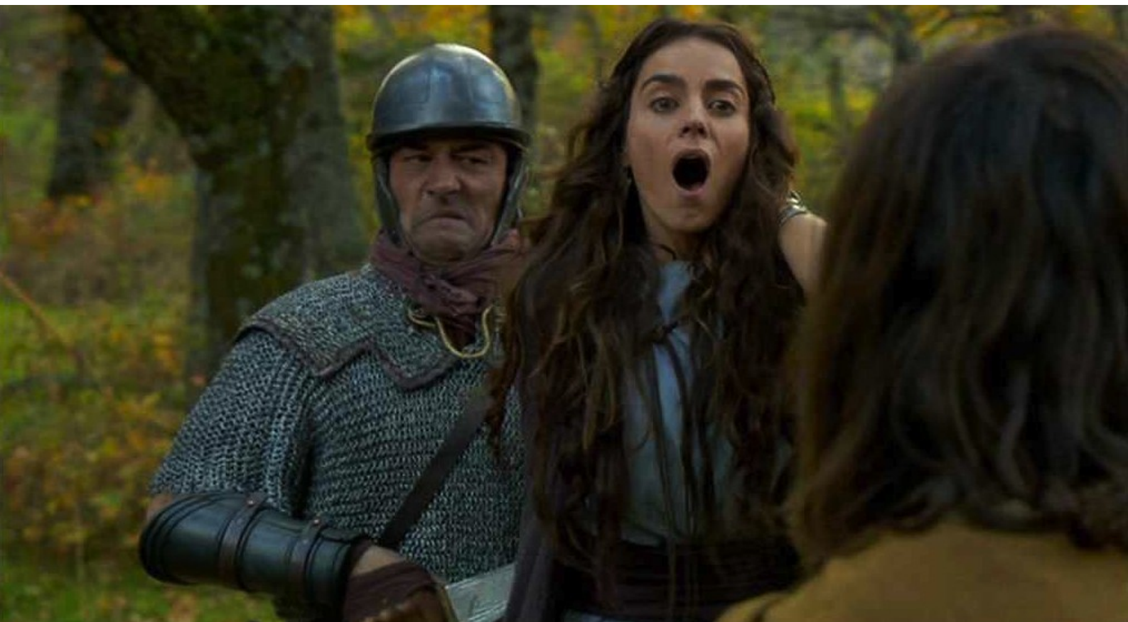
Hispania, la Leyenda : mais est à son tour transpercée par derrière...