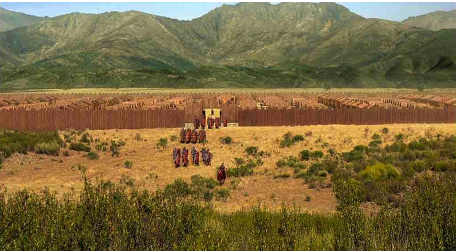
Hispania, la Leyenda : et envoi de nouvelles troupes pour le pourchasser dans une direction opposée,