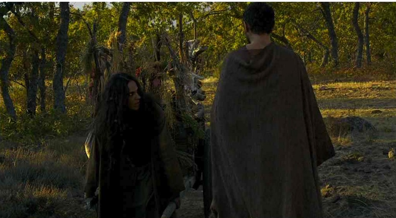
Hispania, la Leyenda : croise une charlatane,