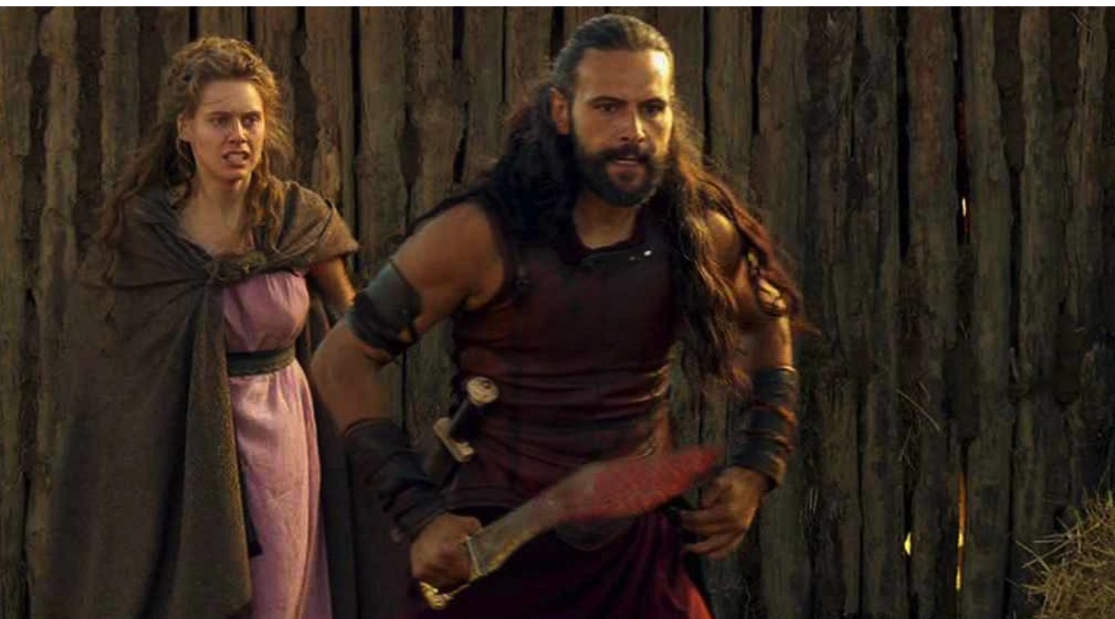
Hispania, la Leyenda : Viriate accourir à son secours,