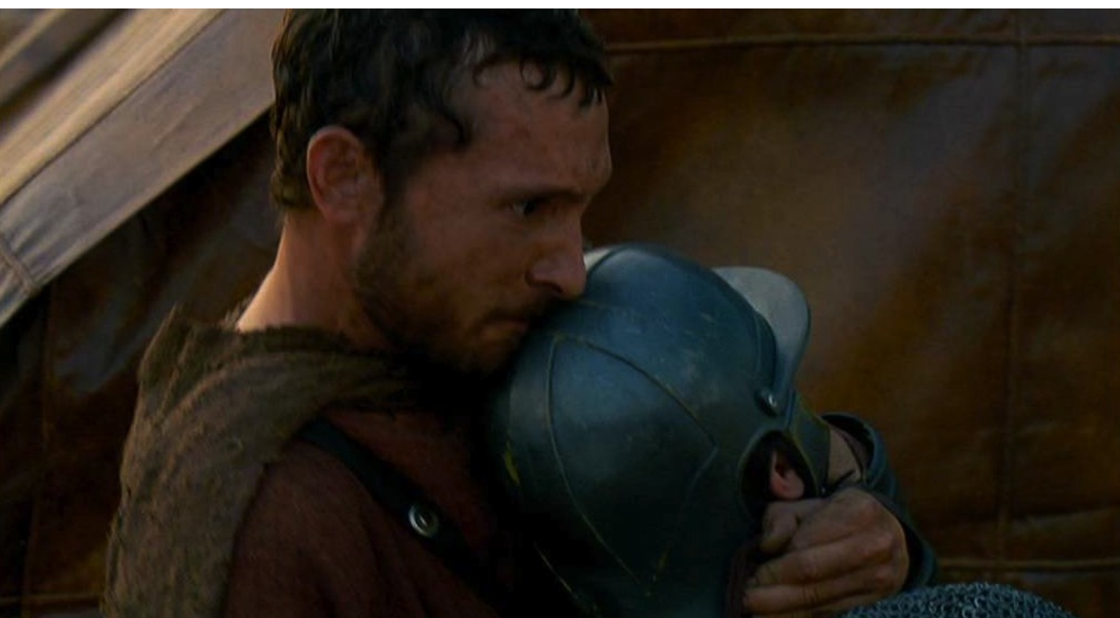
Hispania, la Leyenda : et le poignarde dans le dos,