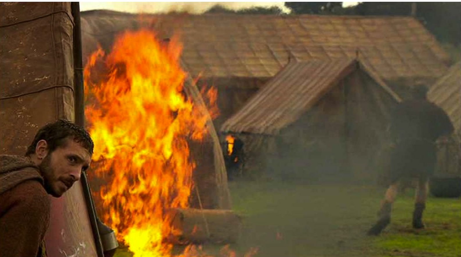
Hispania, la Leyenda : et attend que l'incendie prenne bien,