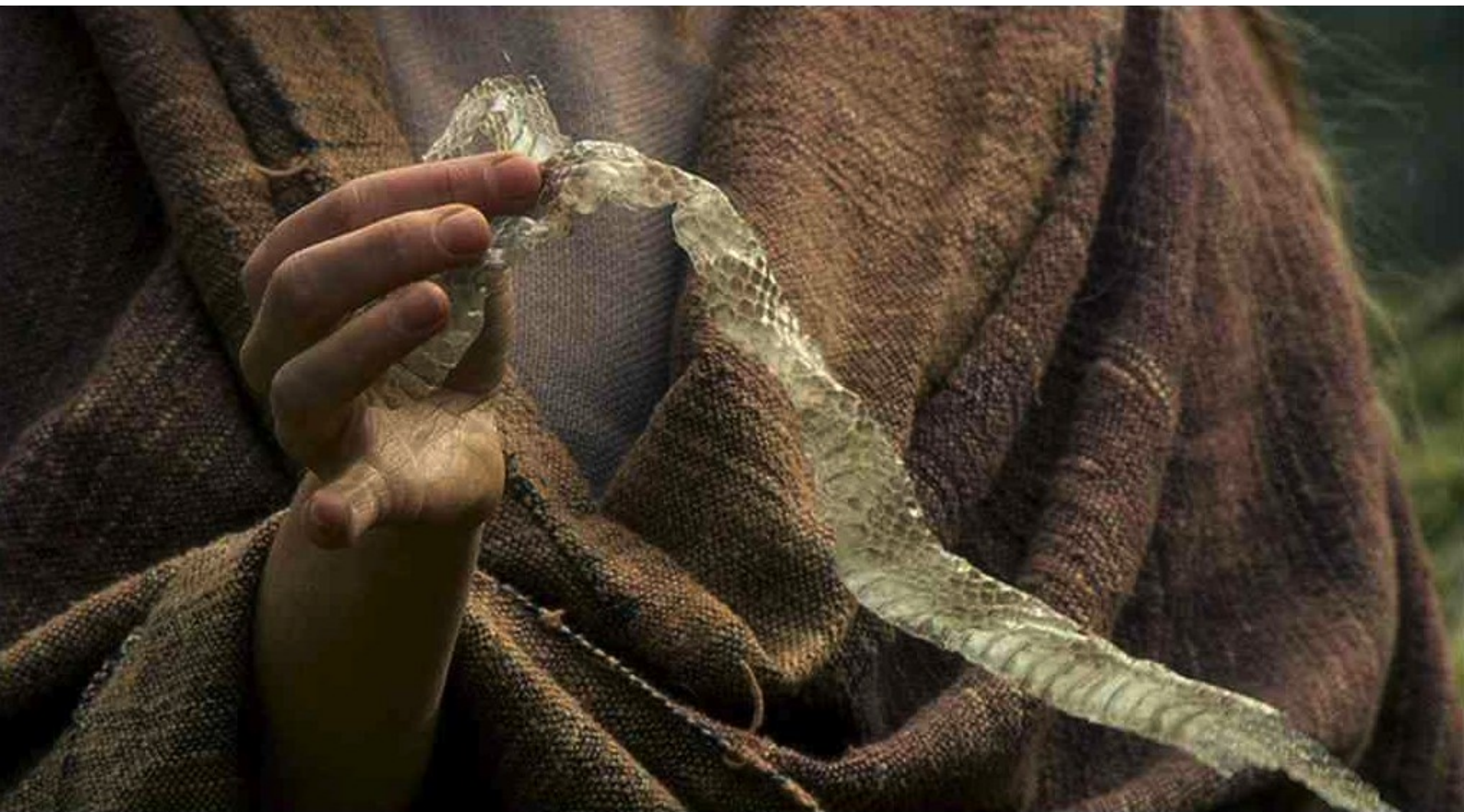
Hispania, la Leyenda : contenant une exuvie de serpent :