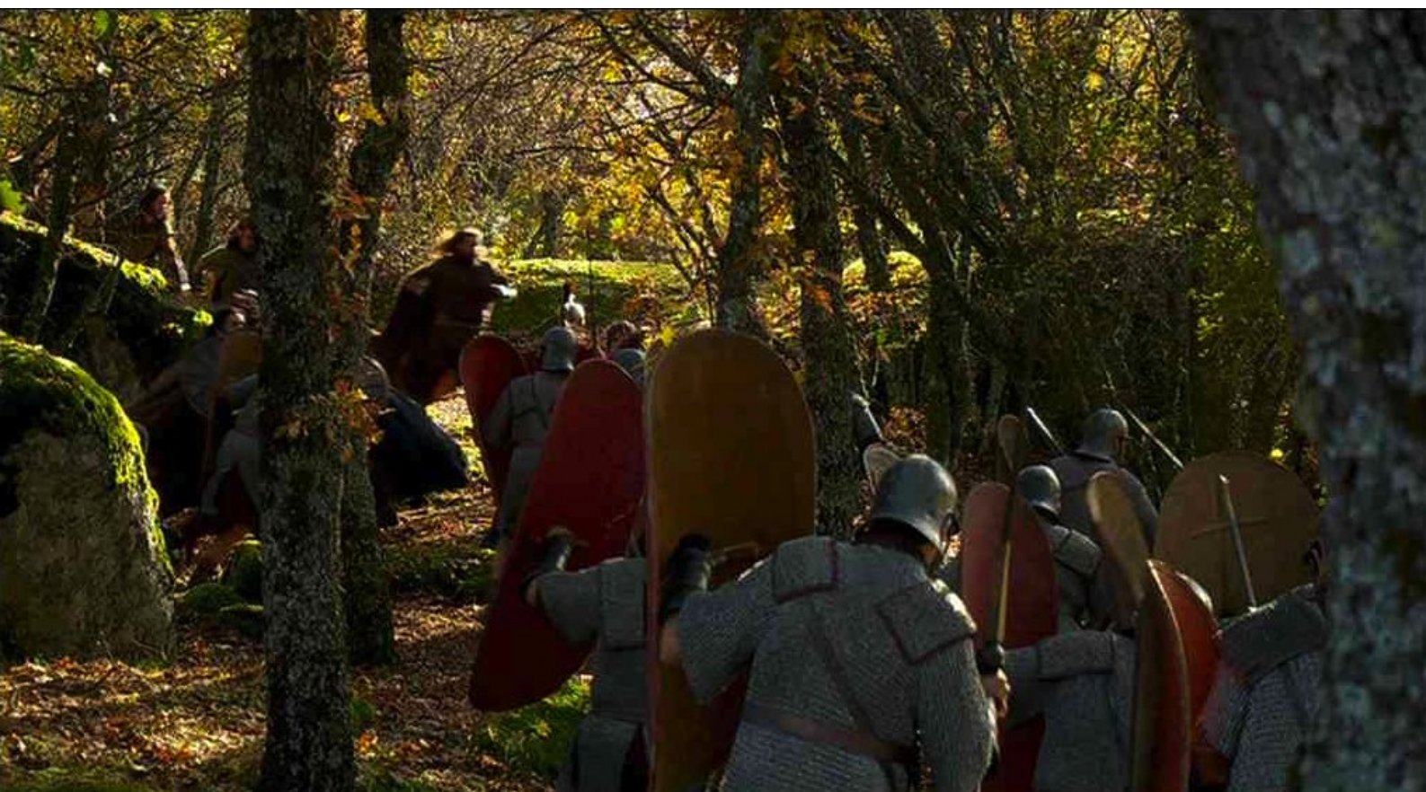
Hispania, la Leyenda : et les Espagnols attaquent soudain la troupe.