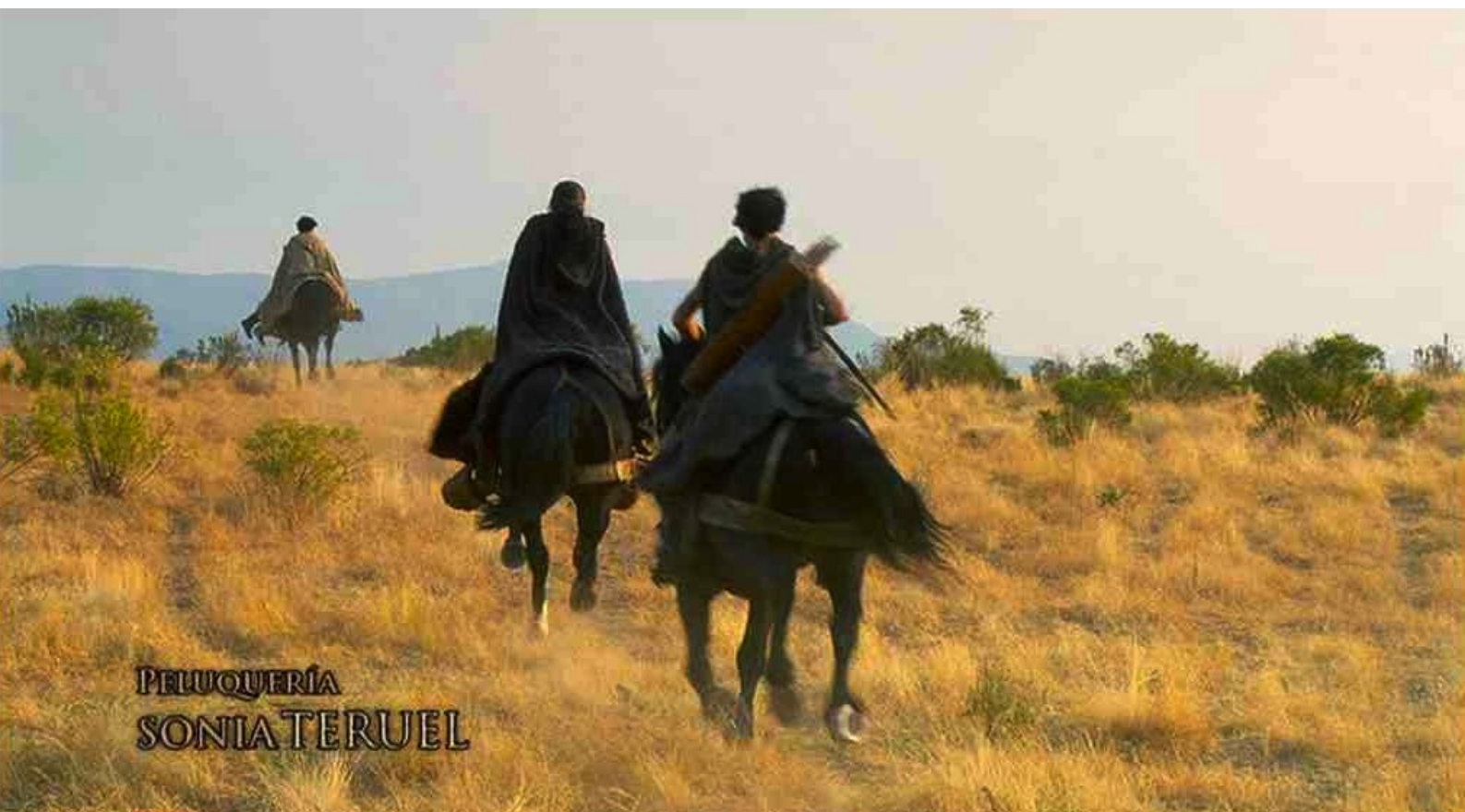
Hispania, la Leyenda : et les landes.