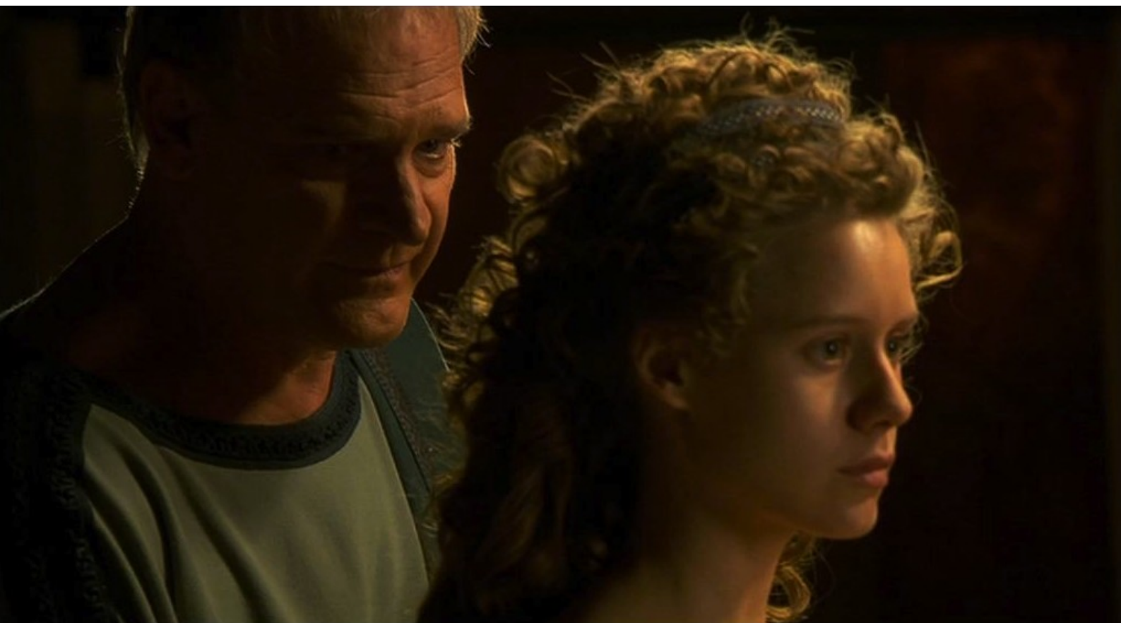
Hispania, la Leyenda : qui lui demande de soigner sa femme,