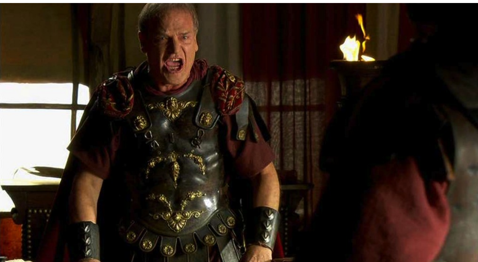
Hispania, la Leyenda : Sous sa tente, Galba, furieux de la tournure des événements,