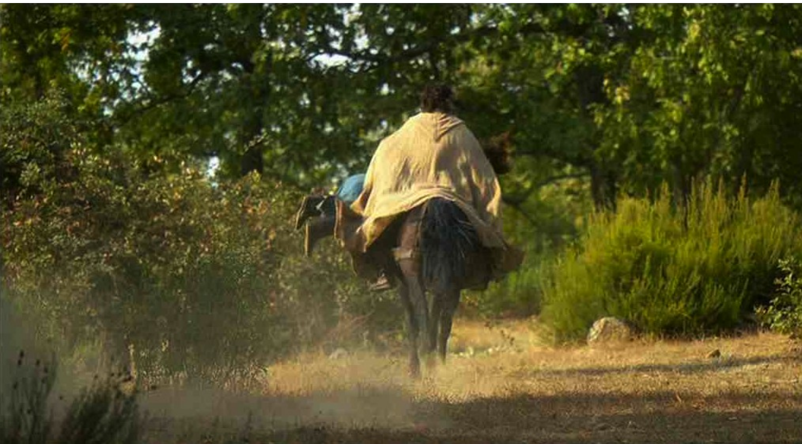
Hispania, la Leyenda : Il commence par narrer la fuite d'Alejo,