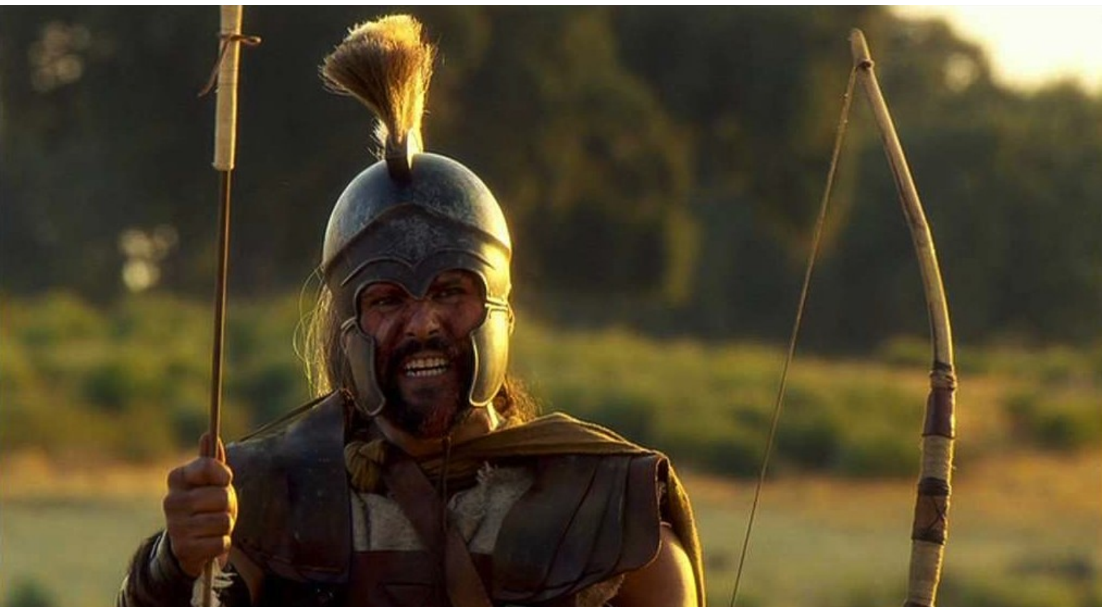
Hispania, la Leyenda : tirer une flèche...