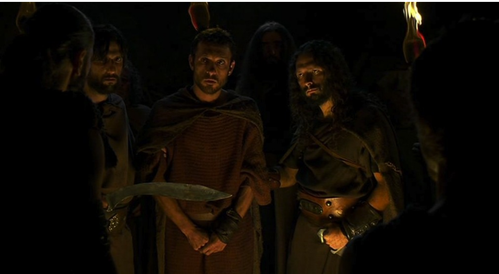
Hispania, la Leyenda : Hector ne sera pas exécuté par les rebelles, mais employé pour une mission.