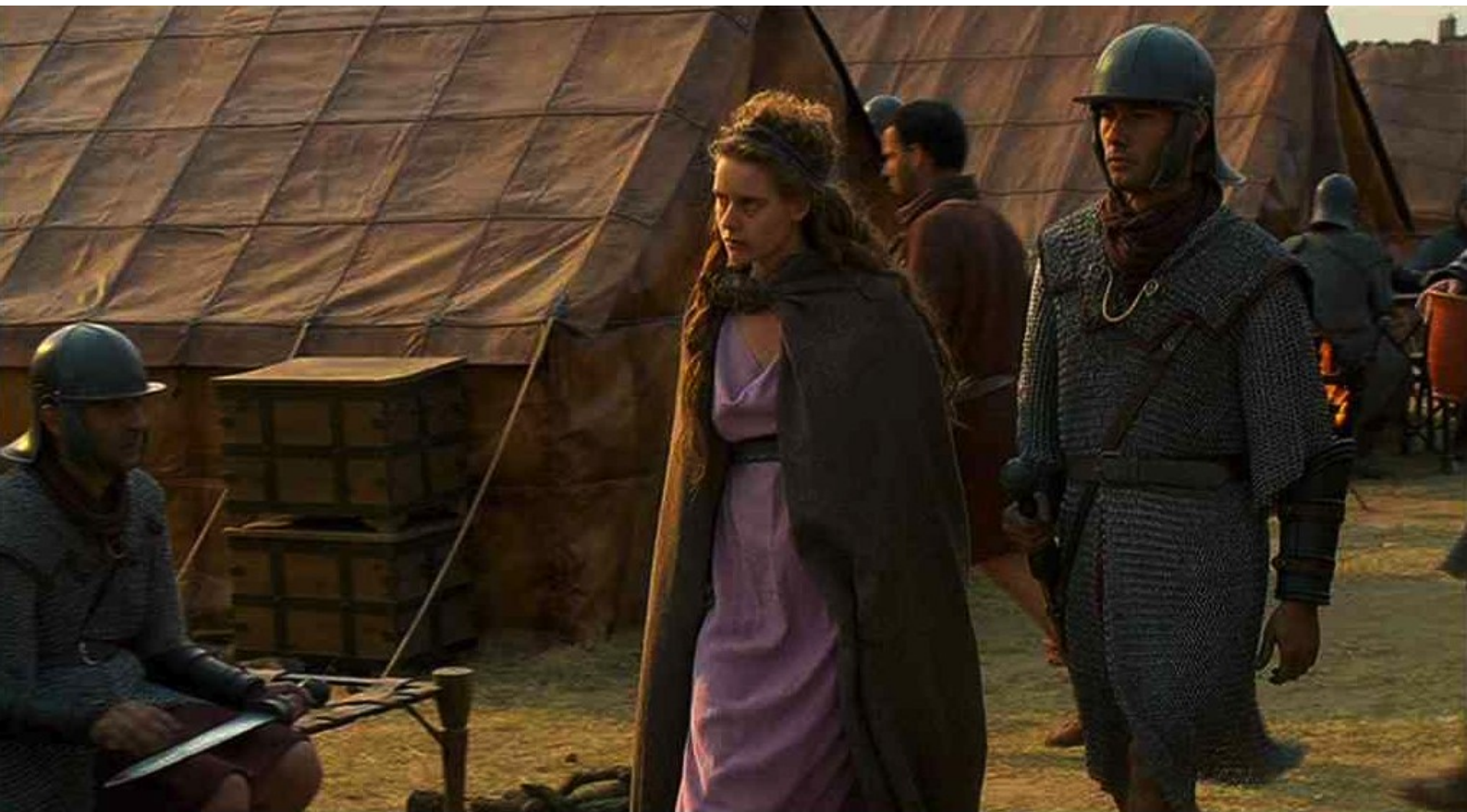
Hispania, la Leyenda : Il se fait amener Helena...