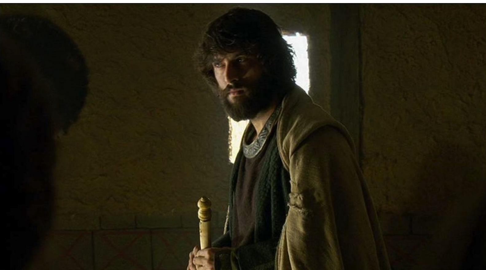
Hispania, la Leyenda : en échange de sa nomination comme chef de Caura.