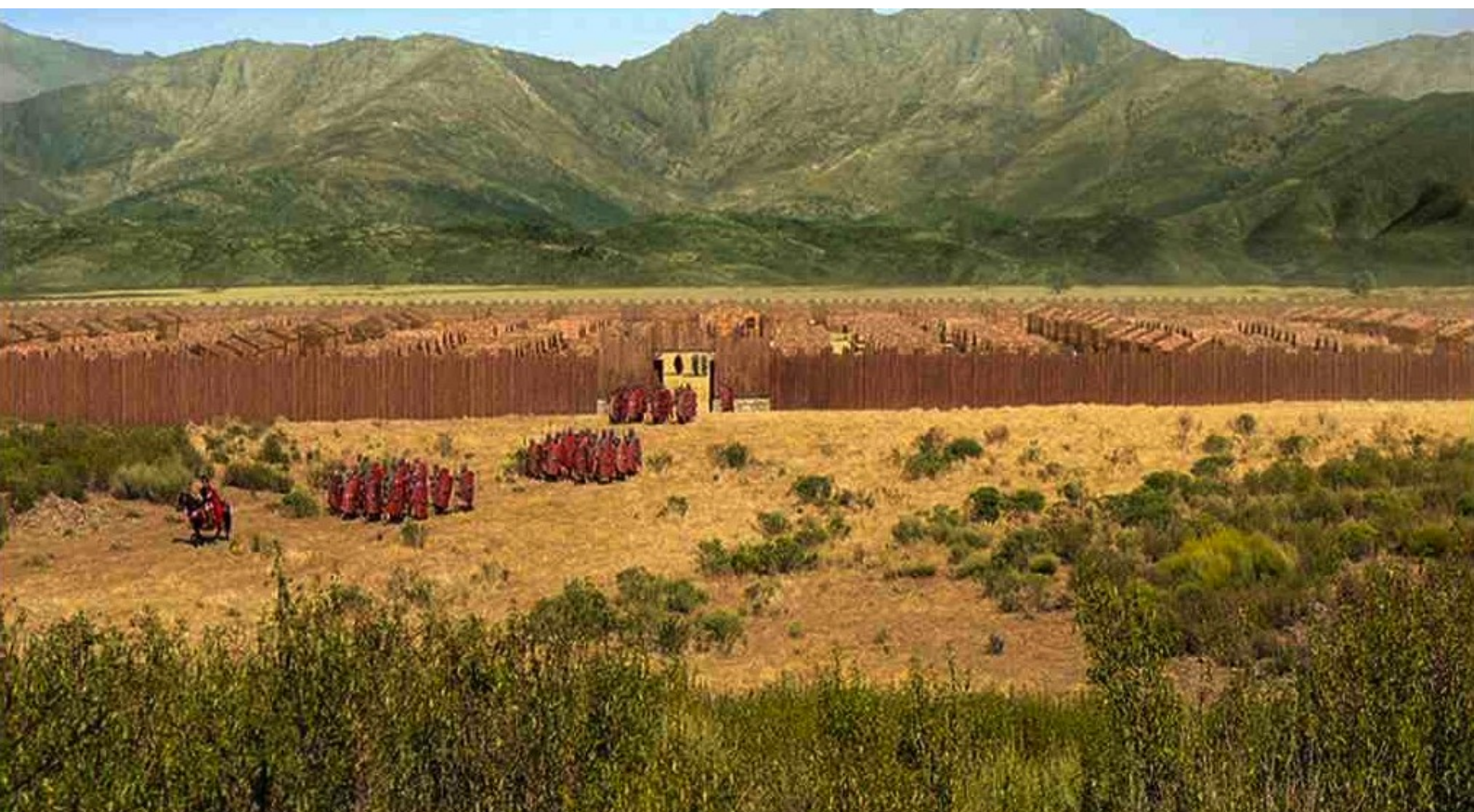
Hispania, la Leyenda : et voient en sortir Marco avec trois centuries.