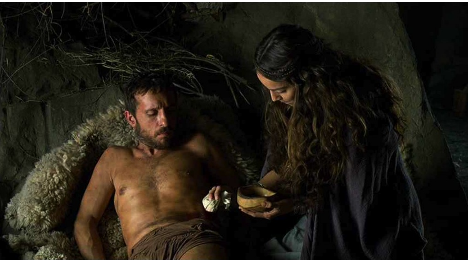
Hispania, la Leyenda : Puis il se blesse lui-même et ainsi se fait admettre au repaire,