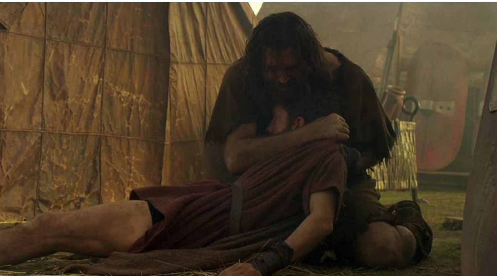
Hispania, la Leyenda : et meurt dans les bras de son frère.