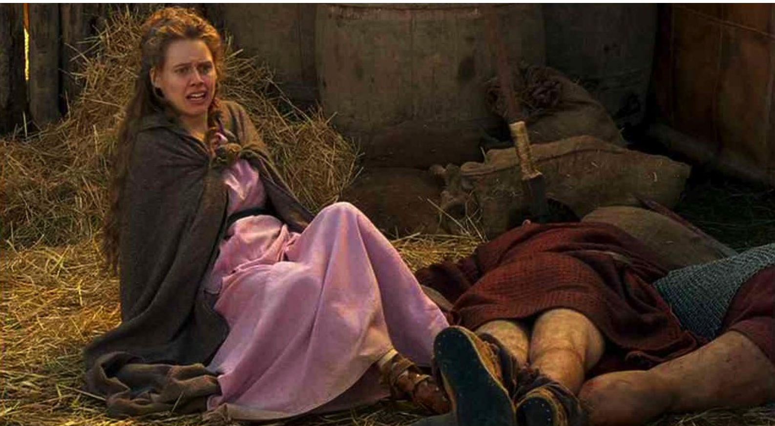
Hispania, la Leyenda : s'effondre, et Helena voit...