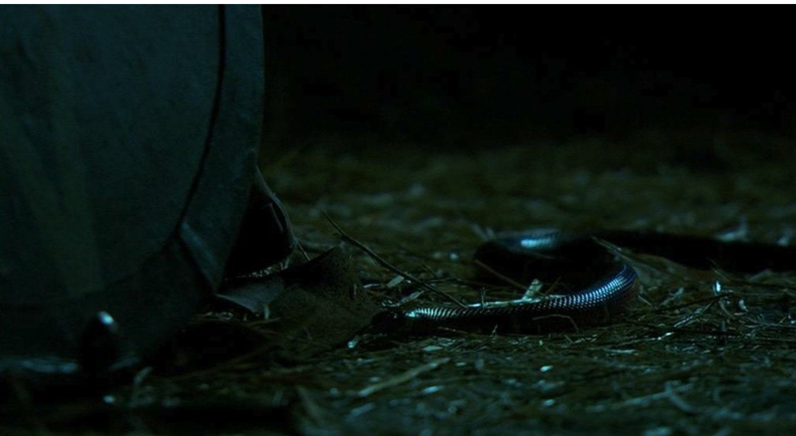
Hispania, la Leyenda : et, la nuit suivante, lâche le serpent à côté de Viriate.