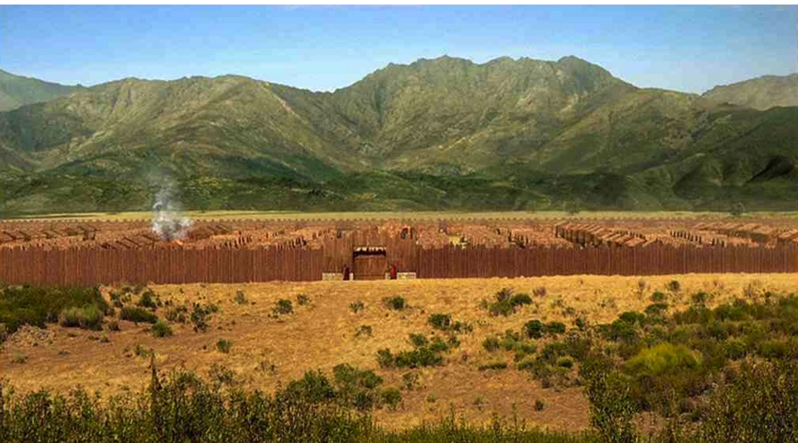
Hispania, la Leyenda : Lorsque les rebelles voient de la fumée monter du camp,