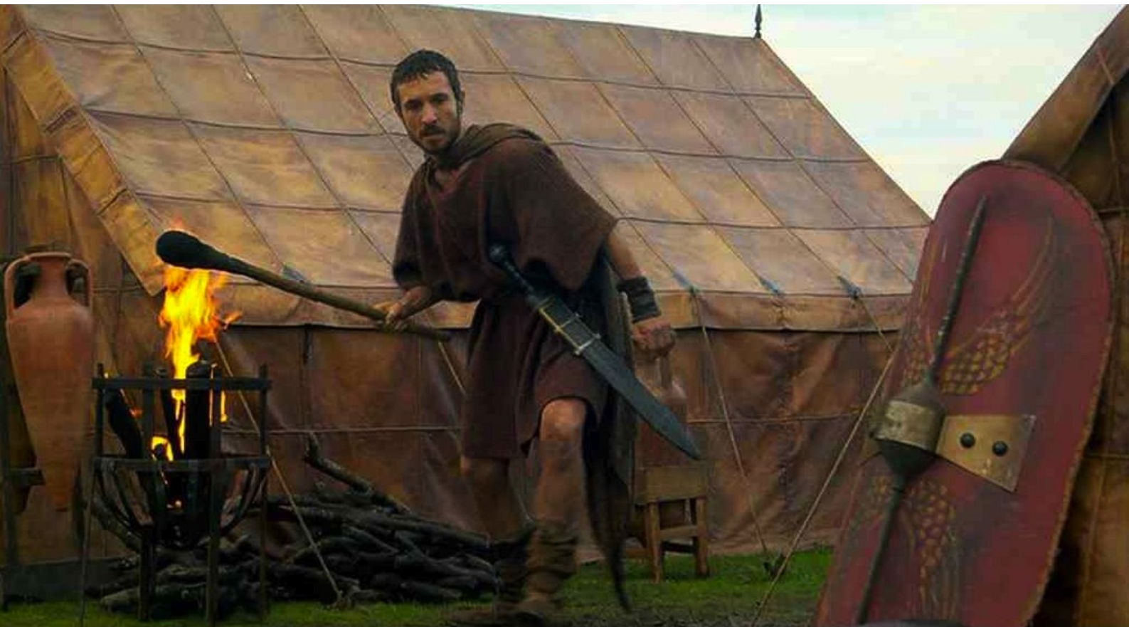
Hispania, la Leyenda : prend une torche,