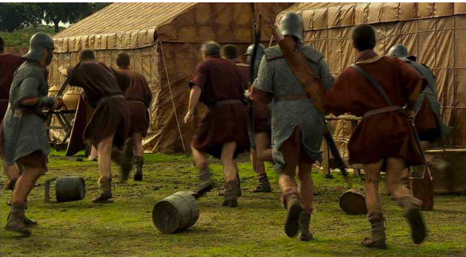
Hispania, la Leyenda : jusqu'à ce que la panique saisisse les Romains...