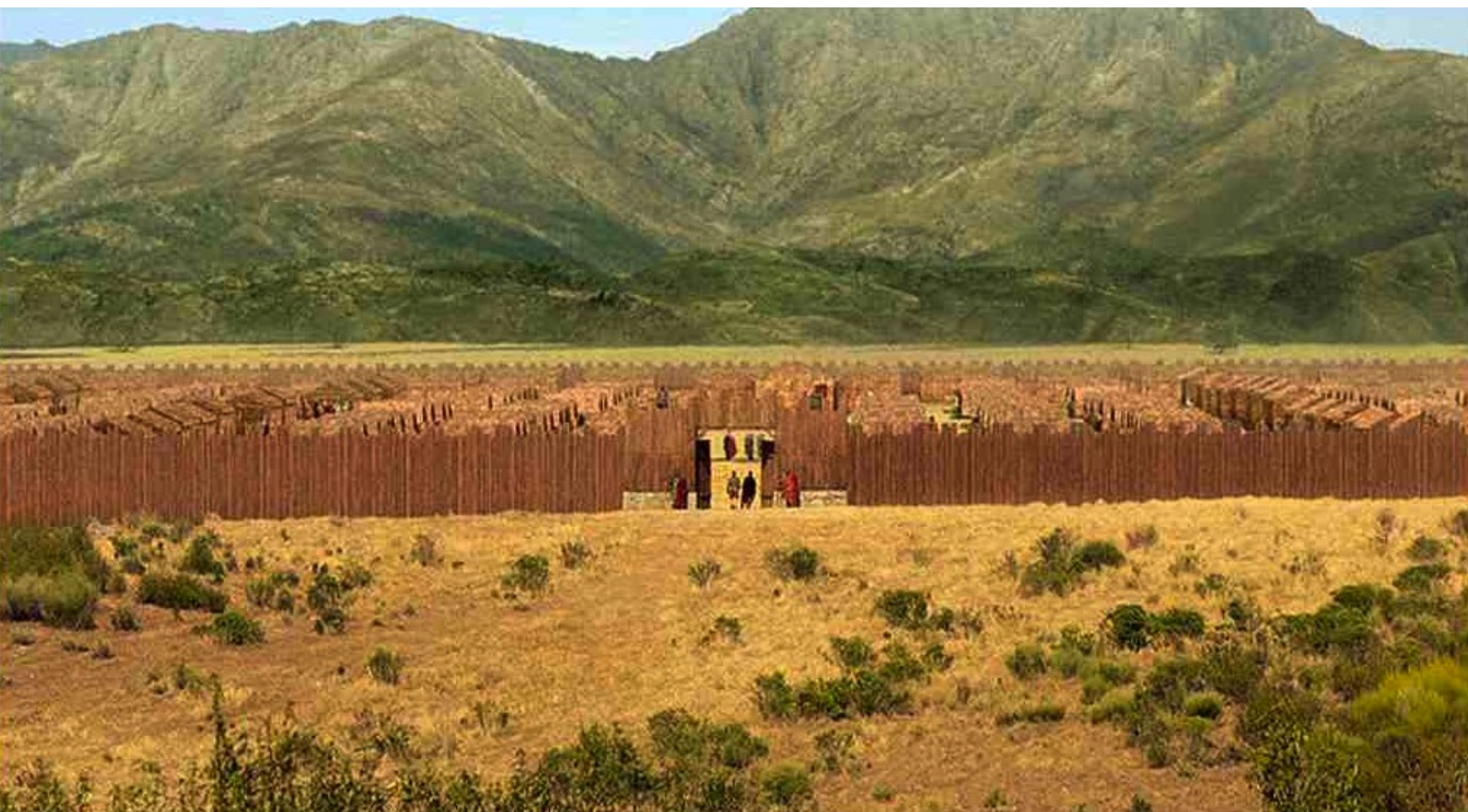
Hispania, la Leyenda : mais, une fois admis dans le camp,