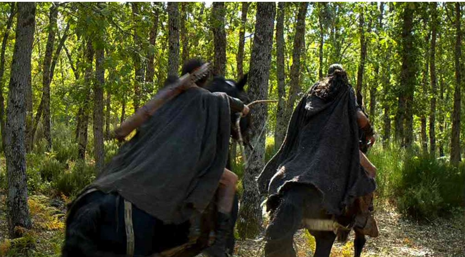
Hispania, la Leyenda : tandis que Paulo et Viriate le poursuivent à travers la forêt...