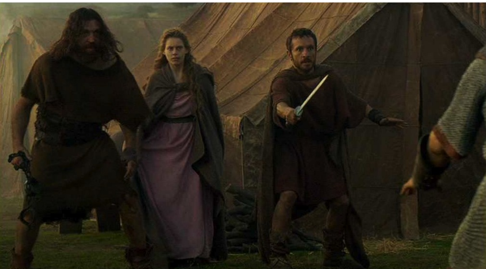
Hispania, la Leyenda : et les fuyards s'appêtent à se défendre ;