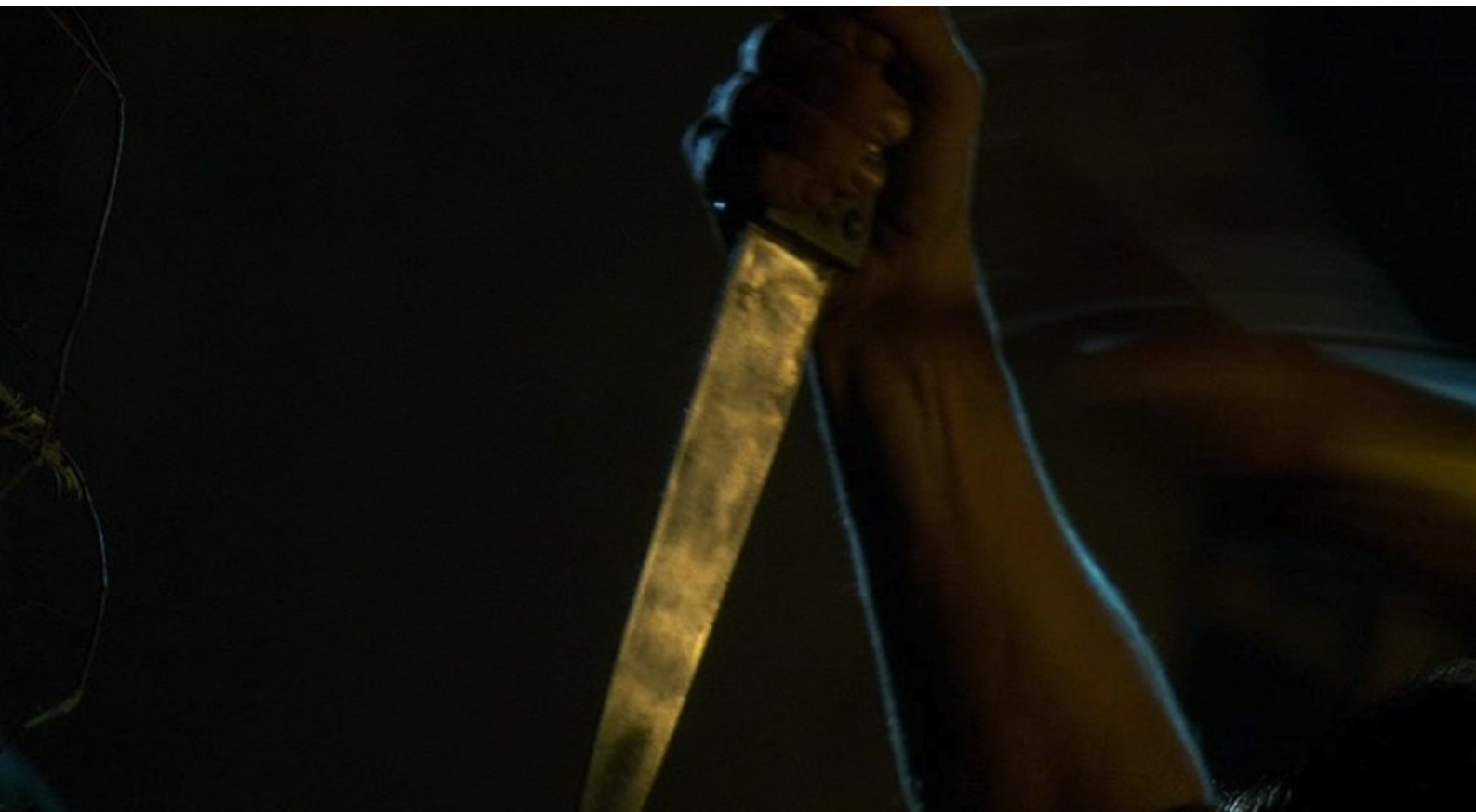
Hispania, la Leyenda : veut le poignarder dans les ténèbres,