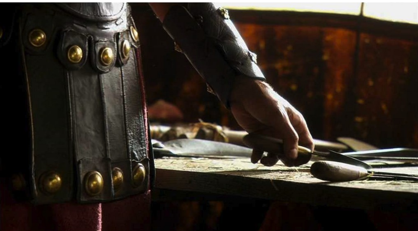
Hispania, la Leyenda : de couper les doigts de Sandro,