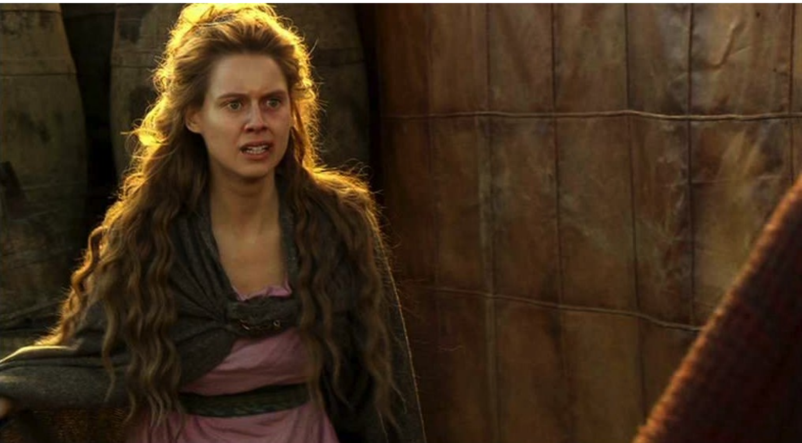
Hispania, la Leyenda : Quant à Helena, elle est acculée...