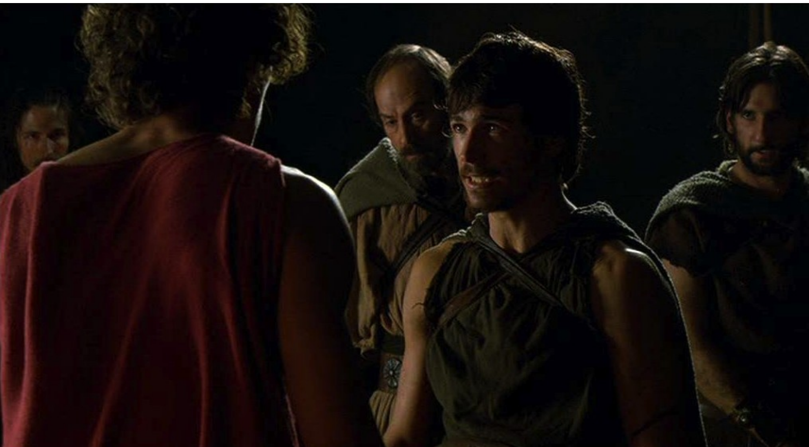
Hispania, la Leyenda : L'attentat éventé, Paulo accuse Fabio tout d'abord,