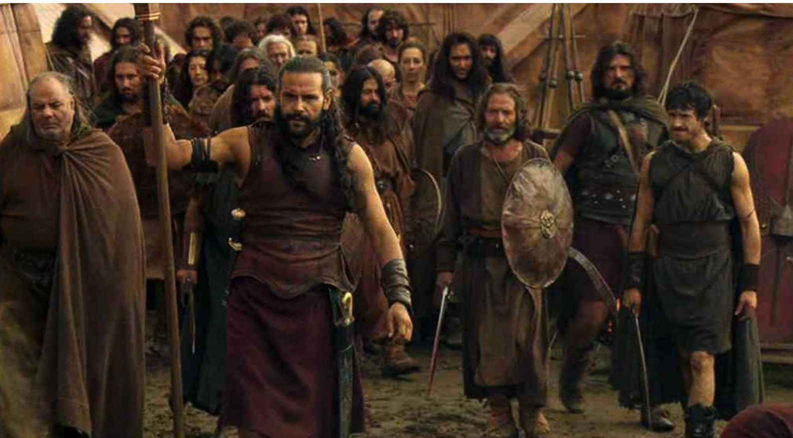
Hispania, la Leyenda : fête sa victoire...