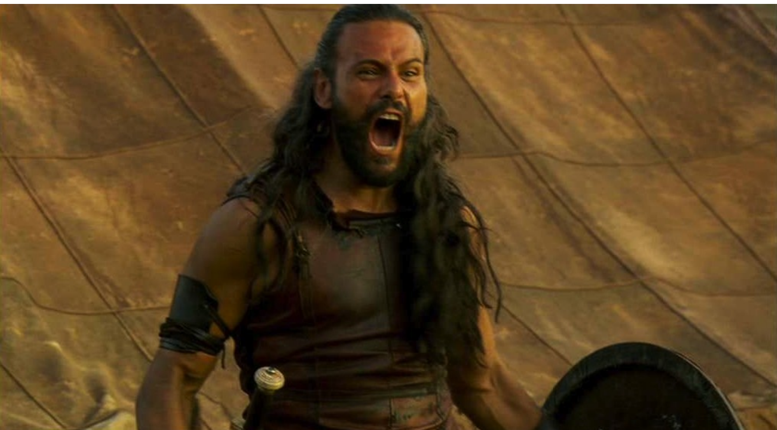
Hispania, la Leyenda : tandis que Viriate encourage ses hommes...