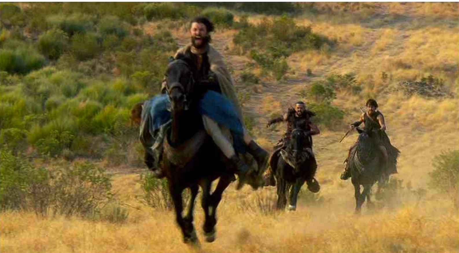
Hispania, la Leyenda : Mais le ravisseur arrive...