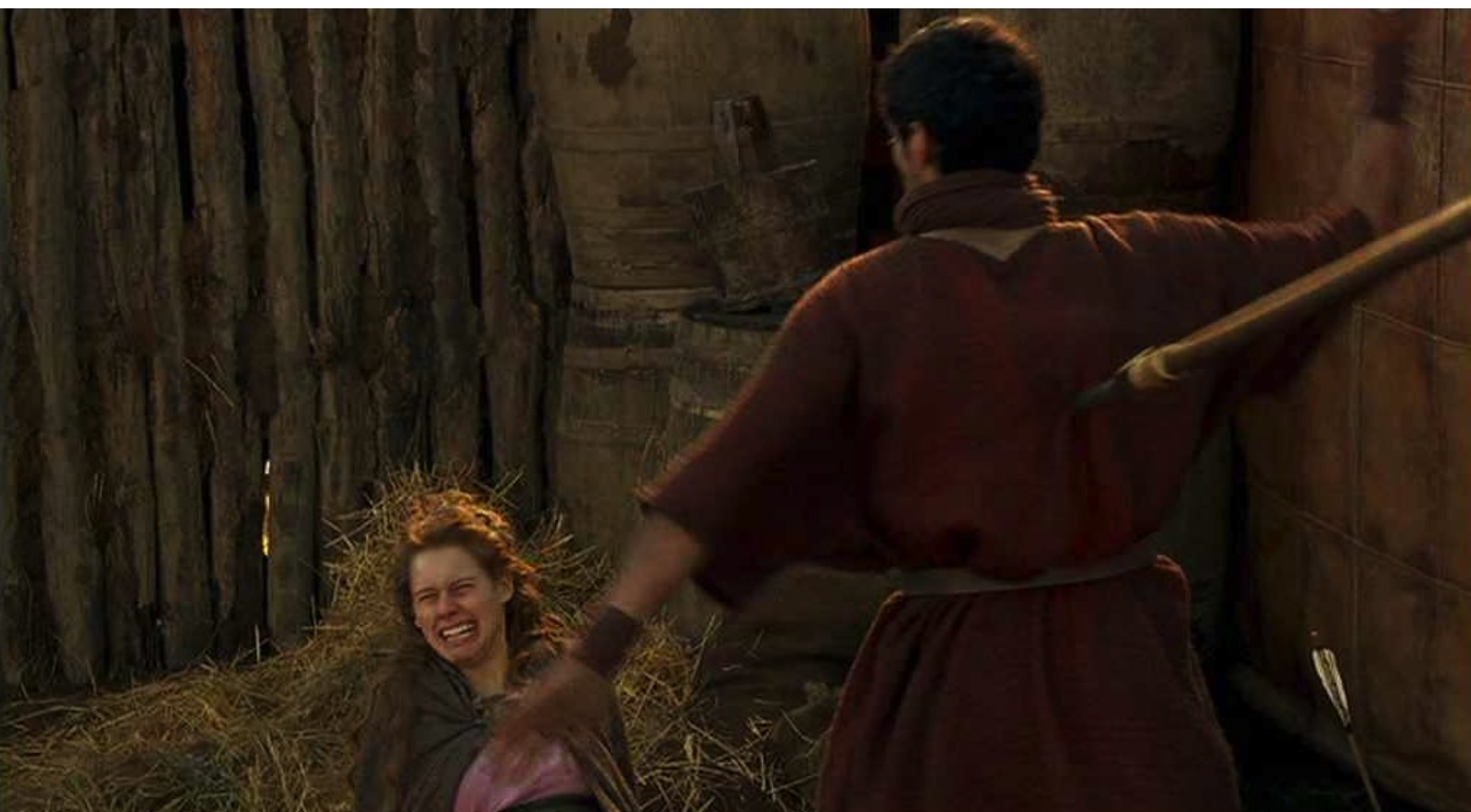
Hispania, la Leyenda : soudain l'agresseur, frappé dans le dos,