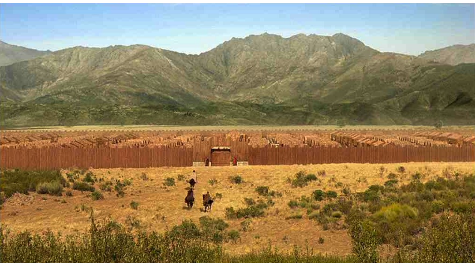
Hispania, la Leyenda : devant le camp romain...