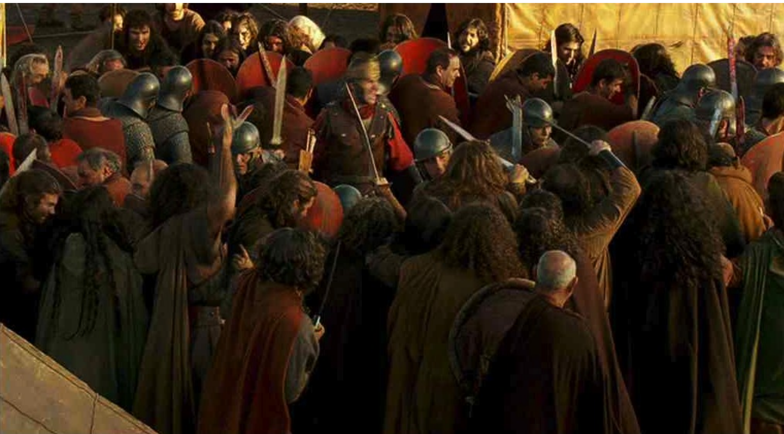
Hispania, la Leyenda : à anéantir la dernière résistance romaine.