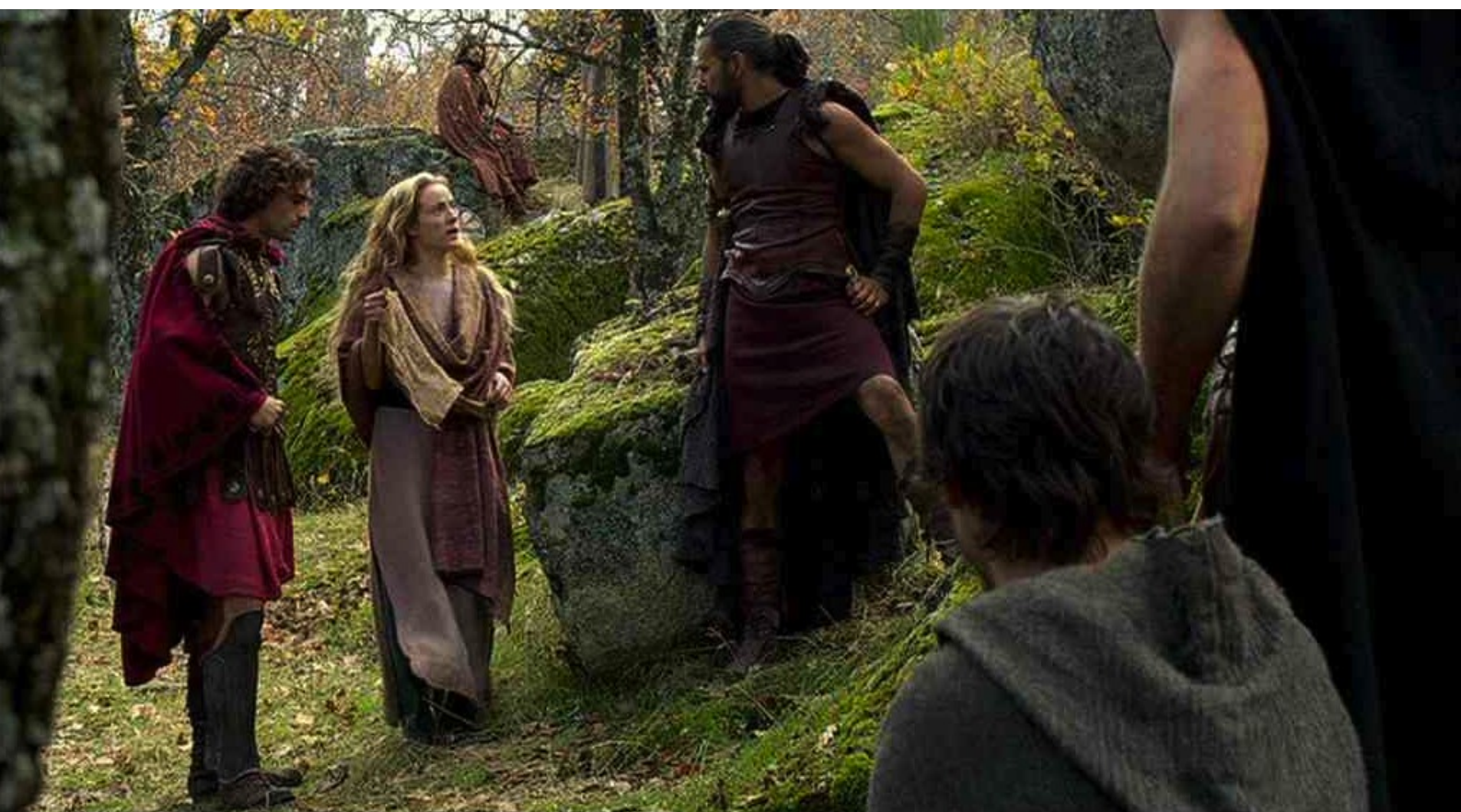
Hispania, la Leyenda : mais Sabina apporte le sac d'Hector,