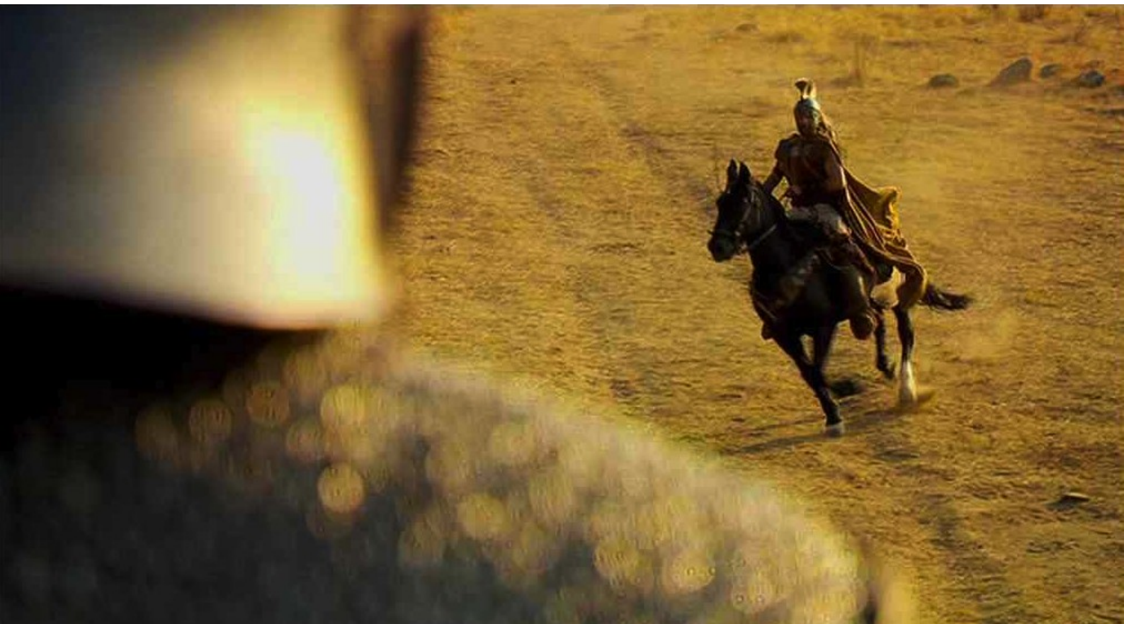
Hispania, la Leyenda : et va devant le camp...