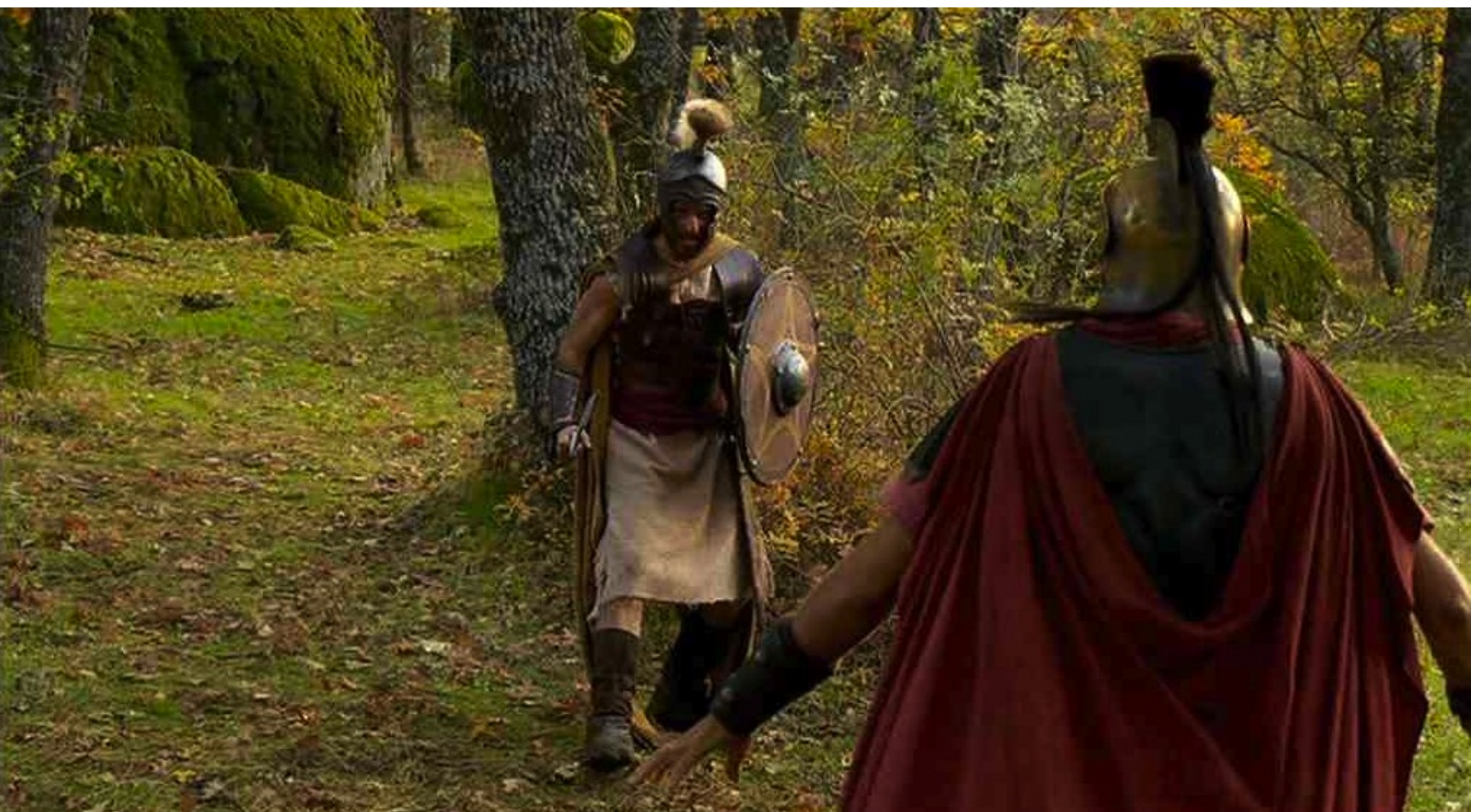
Hispania, la Leyenda : et se précipite pour l'affronter ;