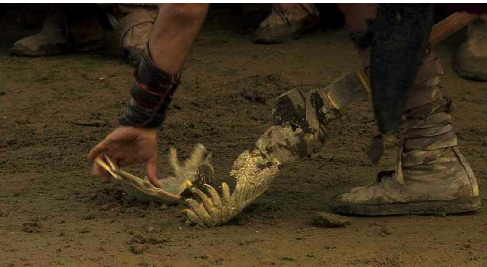
Hispania, la Leyenda : tandis que Viriate, après avoir brisé l'aigle de la légion,