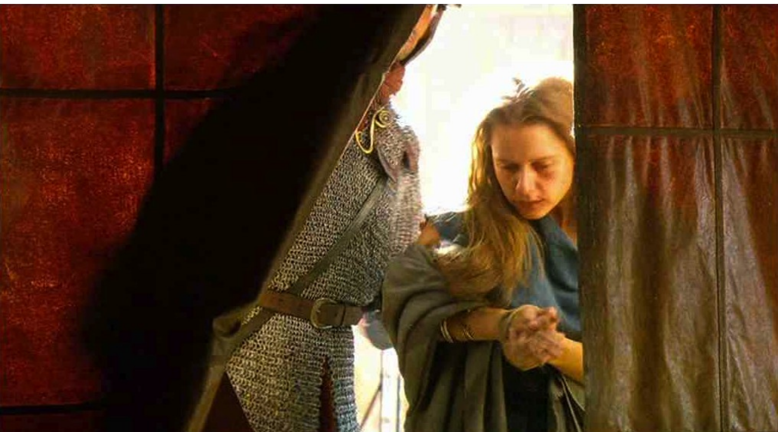
Hispania, la Leyenda : Captive au camp, Helena est menée en prison...