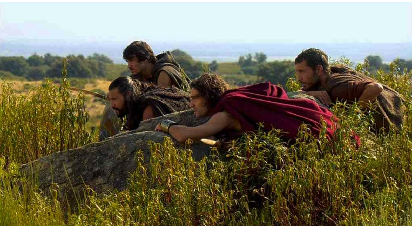
Hispania, la Leyenda : Dans les faits, Viriate et ses amis observent le camp...